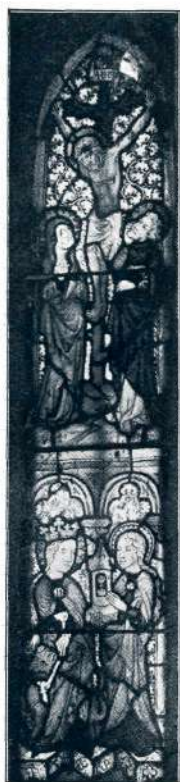
Sl. 19. Breg nad Kranjem, sli- kano okno (1. pol. XV. stol.).