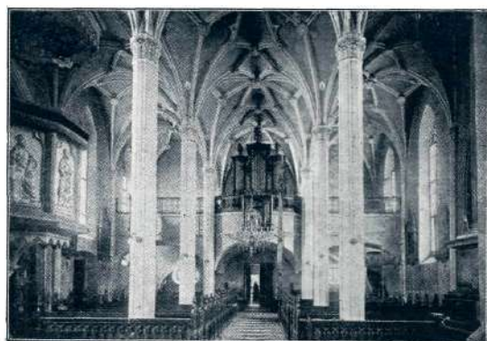
Sl. 20. Škofja Loka, župna cerkev (konec XV. stol.).