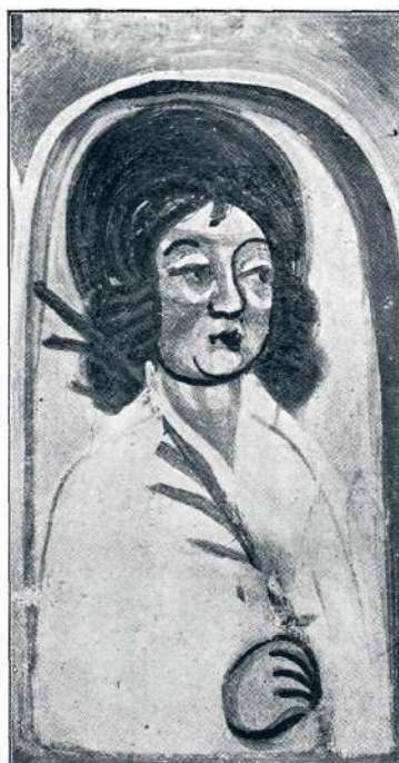
Sl. 17. Slikar prezbiterijskega sv. Ožbalta, Svetnica na Suhi (okoli l. 1534.).