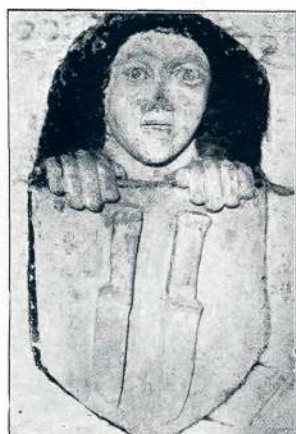
Sl. 22. Mali grad v Kamniku, poznogotski sklepnik.