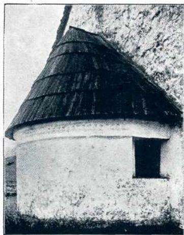
Sl. 16. Draga, prezbiterij (2. pol. XII. stol.).