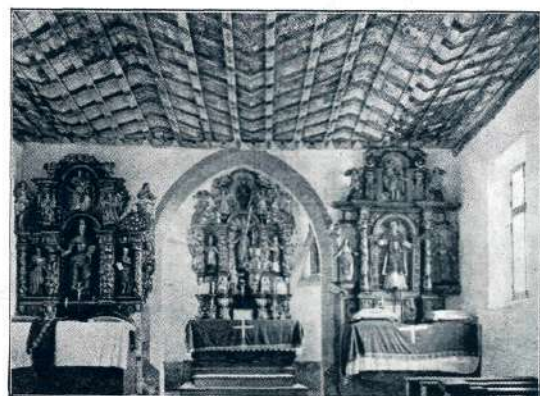
Sl. 23. Sv. Peter nad Kamnikom, poznogotska cerkvica.