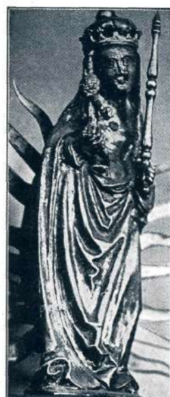
Sl. 21. Kamnik, kipec Matere božje (okoli l. 1500.).