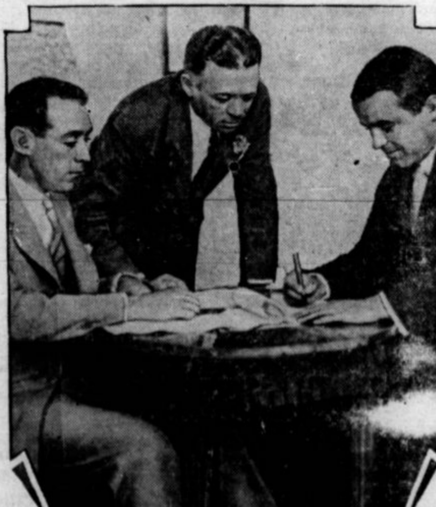
Gene Sarazen, na desni na tej sliki, ki je odnesel prvenstvo v dveh tekmah v golfu, je podpisal kontrakt s newyorikim prometerjem, kateri mu garantira za prihodnji dve leti četrto milijona dolarjev plače. Tak je sport, če je obrnjen v komercialne svrha.