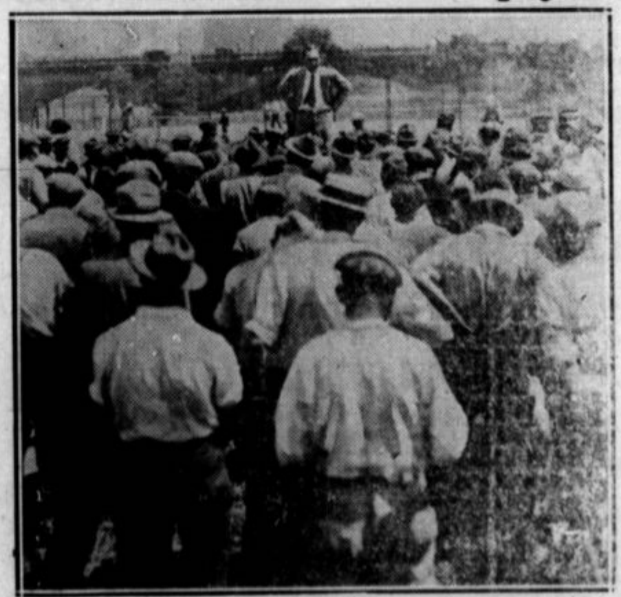
V početku zbiranja vojnih veteranov v Washingtonu v njih demonstraciji za takojšen bonus ni smel noben radikalni govornik, tudi če je sam služil v armadi, govoriti v taborišču. Vodstvo demonstracije je uvedlo strogo disciplino in vojaški red. Ker pa postaja njih boj brezupen, je odstranjena tudi restrikcija proti shodom v taboru, kot prikazuje ta slika.