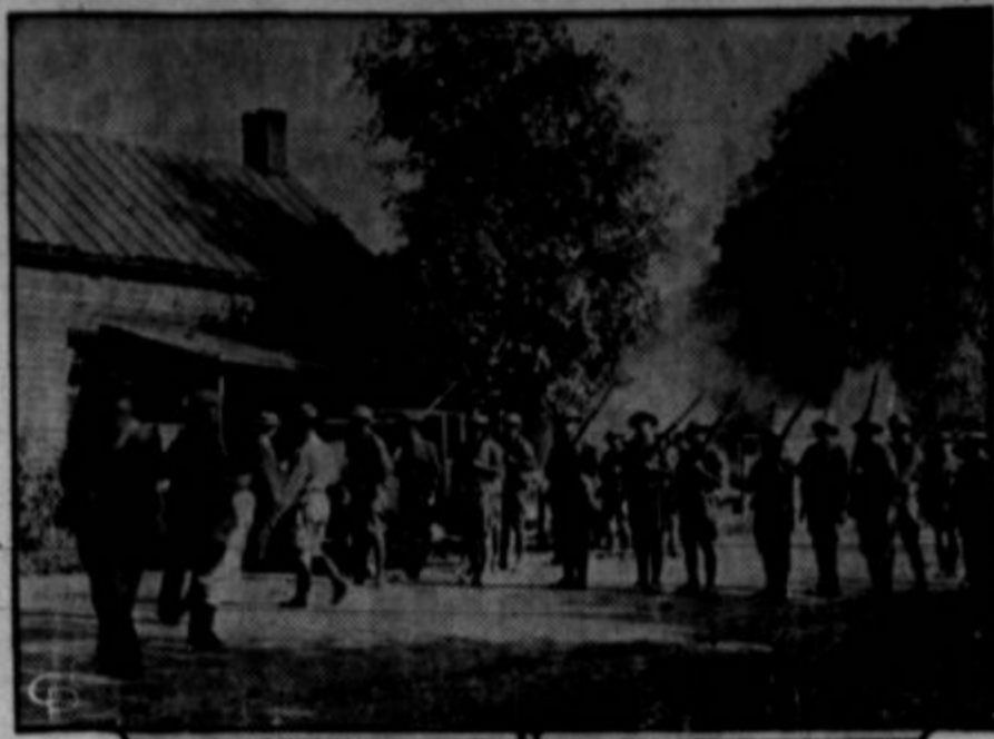
Na sliki je oddelek ohijske državne milice, katere je bila poslana proti stavkarjem Provident majne v Belmont County, ker so v masnem pikniku kompaniji branili obnoviti obrat s stavkopolaj.

jako žalostnih razmerah. In da je mizerija še hujska, se nekateri tolažijo s strupeno pijačo. Na žalost je med temi tudi nekaj takih, ki so bili prej trezni misleči možje. Pred seboj imam resolucijo Ohio Socialist Party, ki urgira, naj ohijska legislatura sprejme socialistični predlog za brezposelnostno zavarovanje. Citam: Sedanje brezposelnostne razmere povečujejo že obstoječo bedo v državi Ohio in po drugih državah; vodijo k vedno večji demoralizaciji in ne ogrožajo samo sedanje generacije, temveč tudi bodoče državljanje.