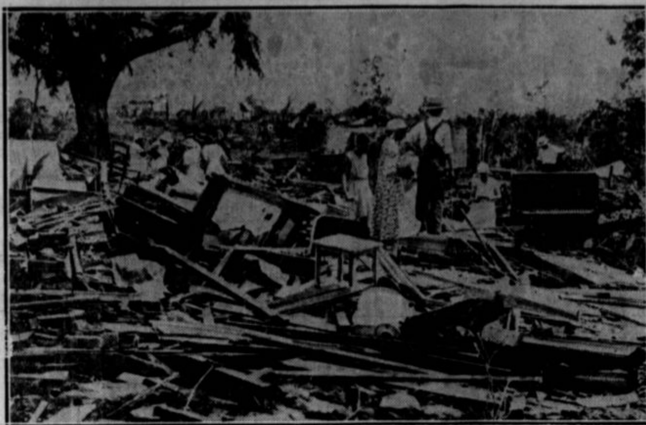
Tornado, ki je obiskal okraj Washington v Kansasu, je porušil mnogo poslopij in pustil za seboj vse v razvalinah. Trije ljudje so izgubili življenje in mnogo je bilo ranjenih.