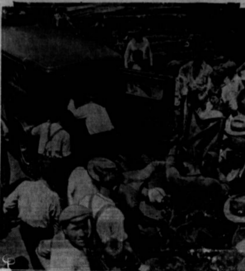
V premogovniku Edna št. 1 blizu Greensburga, Pa., je nedavno ubilo štiri rudarje. Na sliki vidite, ko jih odvažajo od rova.