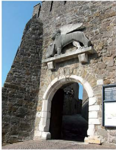
Il Leon di S. Marc parsore dal ingrés dal Cjistiel di Gurize.