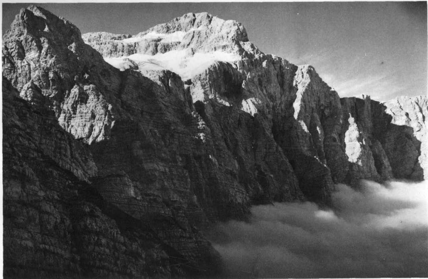
Severna Triglavska stena s Tominškovega pota