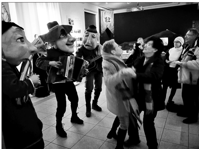
Pustno rajanje na razstavi.