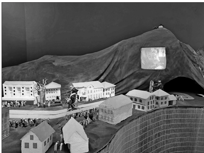
Maketa cerkniškega karnevala na razstavi.

ljudi , ki je posvečen vsakoletni temi karnevala, npr. Polh v škarni, Ščuka na suh'm idr. Vabila in vsebino karnevala so do leta 1991 objavljali v Brestovem obzorniku in, podobno kot danes, v lokalnih glasilih. Po letu 2000 je obveščanje dostopno na spletnih straneh, vsaj desetletje o prireditvi Pust v Cerknici lahko beremo na spletni strani PDC. Cerkniki karneval je tudi medijsko zelo odmeven, karnevalske norčije je nacionalna televizija spremljala v letih 1988, 1989 in 1993. Večkrat je bil pokrovitelj karnevala Nedeljski dnevnik , leta 1988 celo s posebno prilogo Cerkniški žaromet ; v tem času je pokroviteljstvo prevzel še časopis Pavliha . Velike stroške izdelave mask in organizacije prireditve so do leta 1994 nosili podjetje Brest, Loška dolina z malimi podjetji in organizacijami ter Občina Cerknica, ki je danes glavna pokroviteljica prireditve.