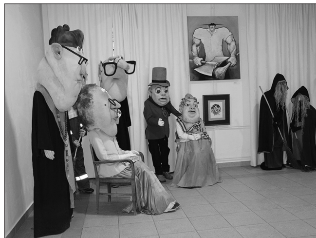
Originalne karnevalske maske na razstavi.

Kot prvi lik v karnevalskem sprevedu nastopi Martin Krpan s svojo kobilico, zatem jamski zmaj s skupino praljudi – pravodičev iz Postojnske jame s sv. Hieronimom na oslu, sledi jim Jezerko s skupino Jezercev, žabec Rego z žabami, velika ščuka z ribiči, skupina polhov s hudičem