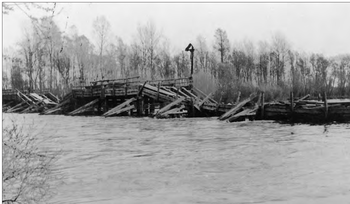
Porušeni cestni most med Dokležovjem in Veržejem, april 1941.