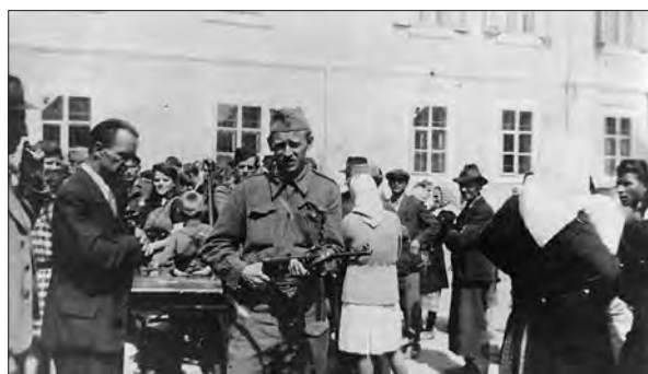
Partizani v osvobojenem Ljutomeru leta 1945.