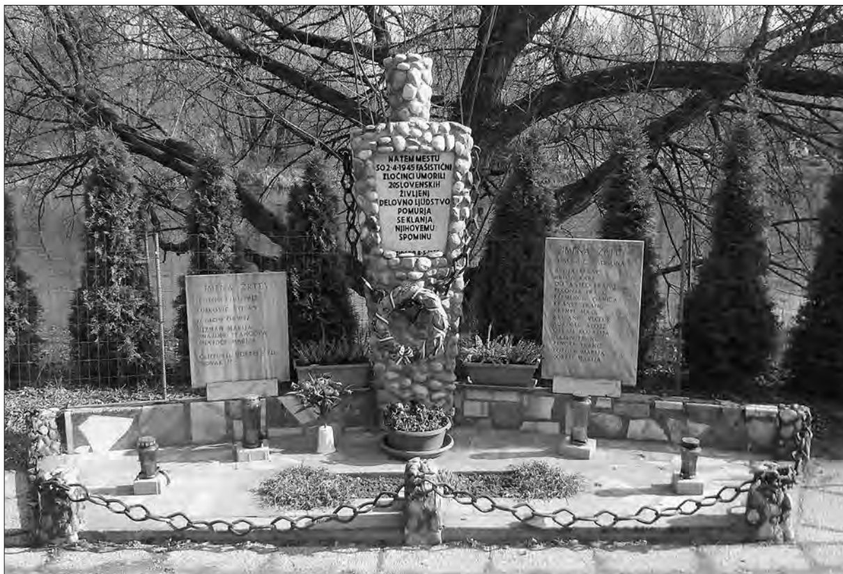
Spomenik žrtvam druge svetovne vojne pri nekdanjem Smodiševem mlinu (osebni arhiv avtorja).

tivista, ki so ga na begu ubili. Kozaki so gospodarja isti mesec ustrelili kot talca v Radvanju, medtem ko so njegovo ženo poslali v taborišče in mlin izropali. 52