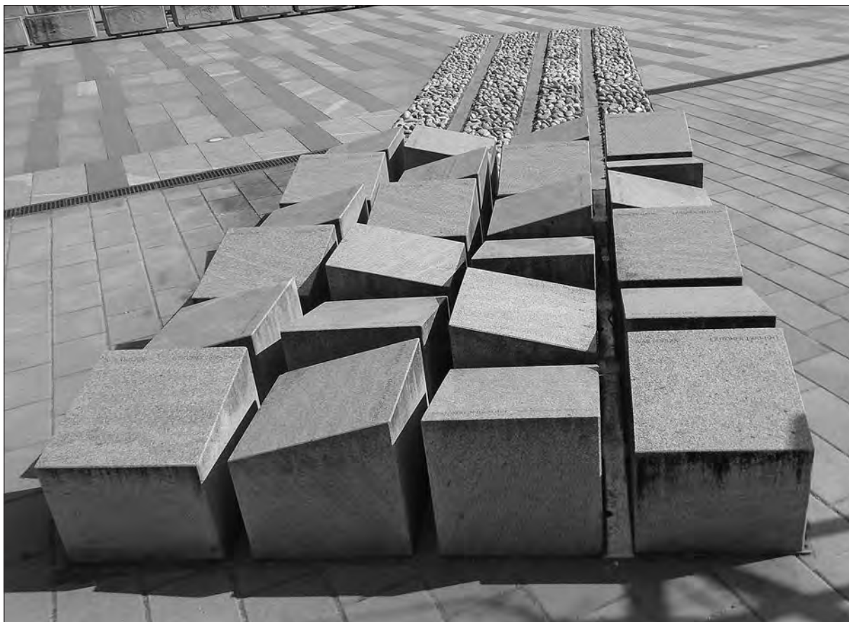
Spomenik padlim med drugo svetovno vojno na Glavnem trgu.