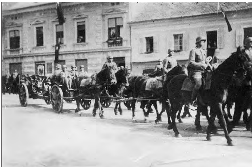
Nemška vojska v Ljutomeru leta 1941 (hrani Splošna knjižnica Ljutomer, OE Muzej).

je bila nameščena po različnih mestih (Gornji Radgoni, Ljutomeru, Ormožu, Središču ob Dravi) ter okoliških vaseh. S tem se je vzpostavila prvotna vojaška uprava oziroma okupacija tega ozemlja, ki je lokalnemu prebivalstvu ostala v spominu predvsem po plenjenju lokalnih trgovin s strani nemških vojakov. 4