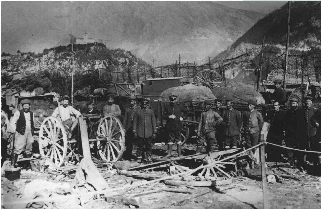
Nemški vojaki pri Idrskem, v ozadju cerkev Sv. Antona v Kobaridu.