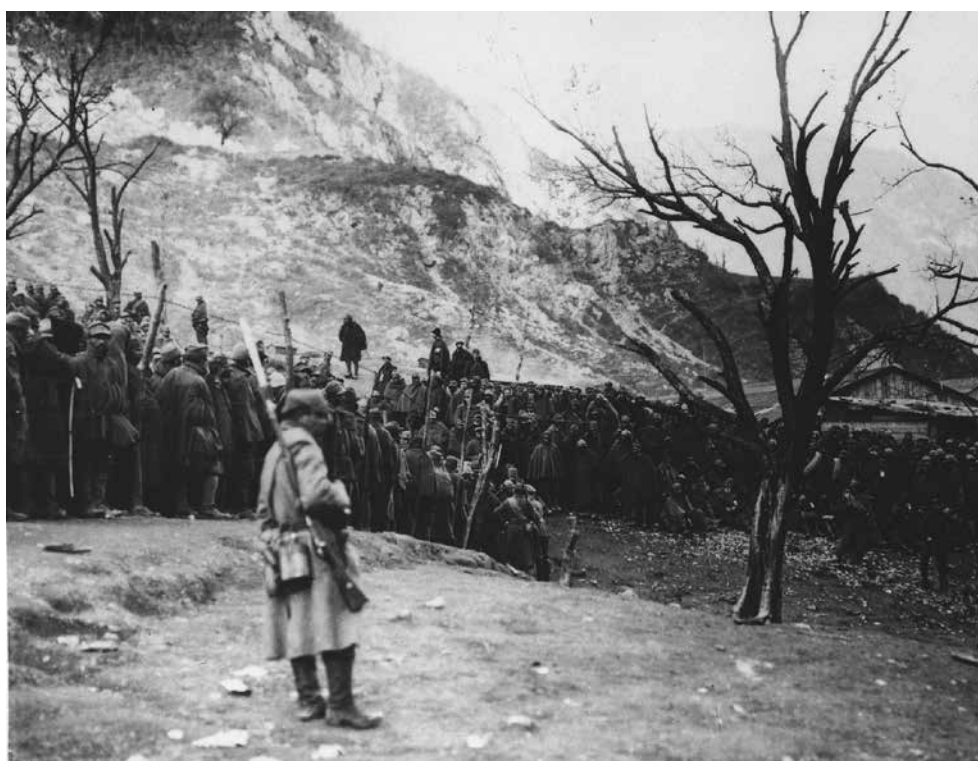
Začasno taborišče za italijanske vojne ujetnike pri Kneži, november 1917.