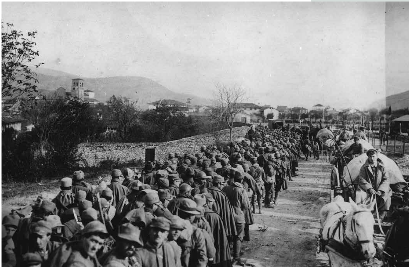
Italijanski vojni ujetniki pri Čedadu, oktober 1917.