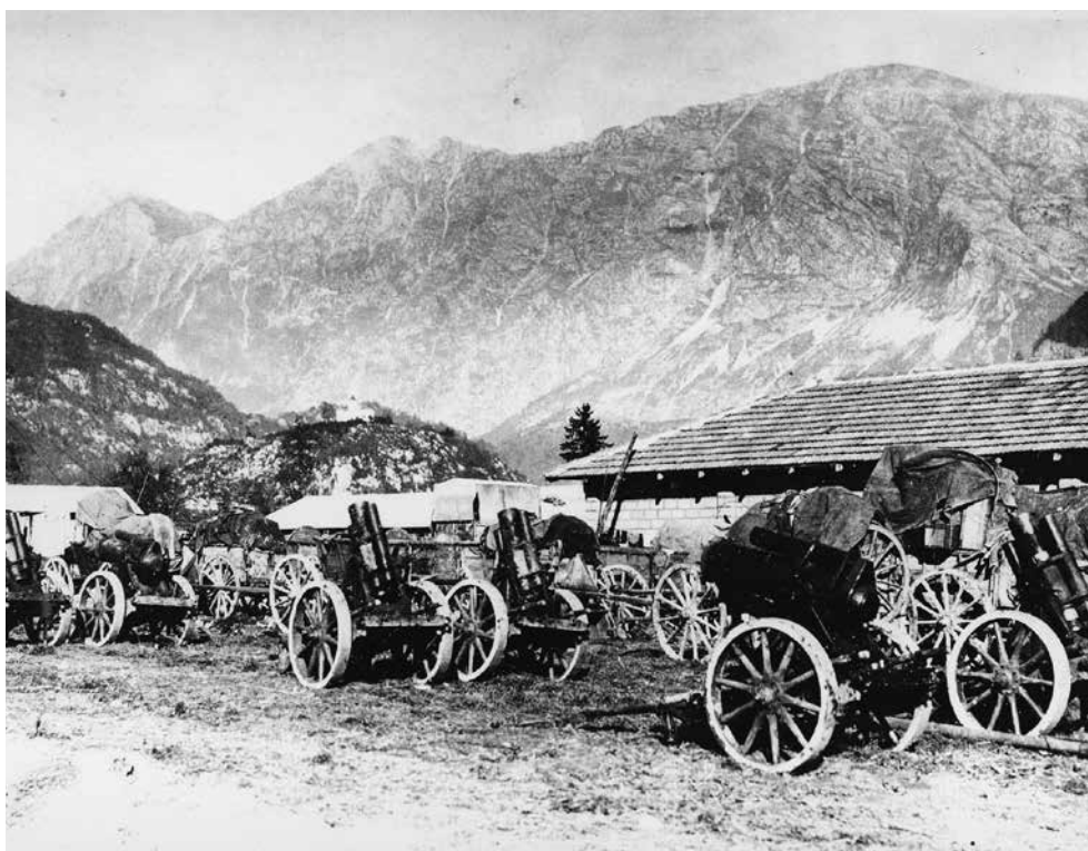
Nemški topovi in vojaška oprema pri Kobaridu.