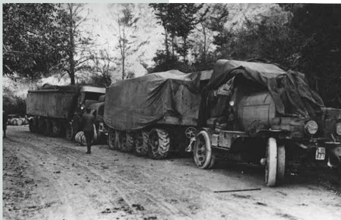
FOTO ZGODBA S PRIZORIŠČ PREBOJA SOŠKE FRONTE PRI KOBARIDU IN UMIKA ITALIJANSKE VOJSKE 1

Za potrebe avstro-ogrsko-nemške ofenzive oktobra 1917, je bilo treba v Zgornje Posočje prepeljati veliko vojaške opreme, orožja in vojakov. Slika prikazuje prevoz možnarja in opreme na cesti proti Podbrdu.