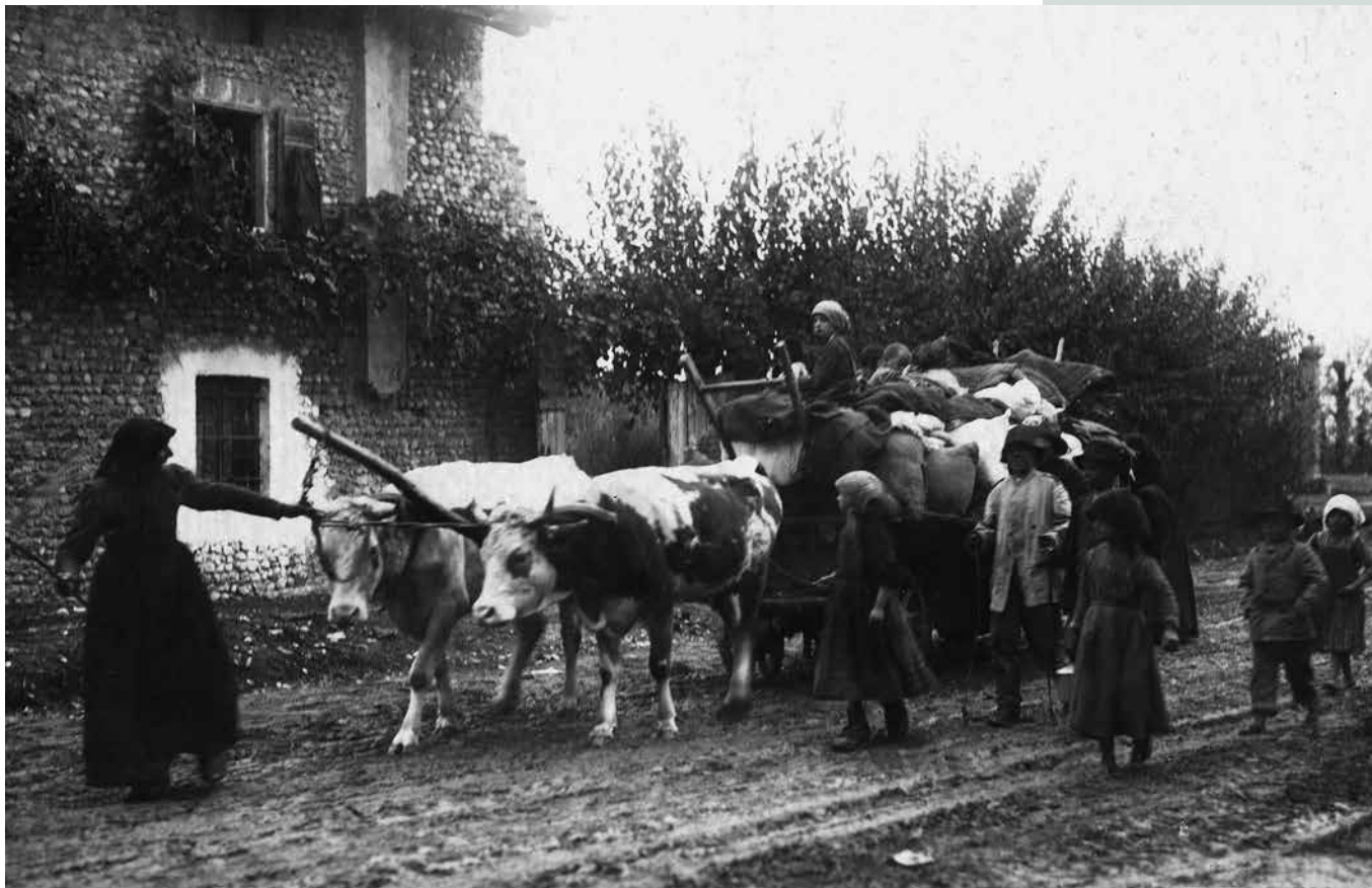
Begunci pri Vidmu na begu pred vojno.