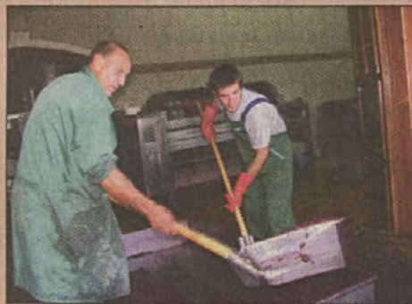
Jarkovičeva klet v Gadovi peči

grozdja preveč in tudi Jarkovičevi v Gadovi peči bodo težko odkupili vse ponujene količine. Poleg tega v deželo dolenskega posebnega s štajerskega konca roma čez Savo grozdje, tudi modre frankinje, ki lahko oplemeniti tudi cviček. Je pa mogoče izpostaviti še en problem; ker je država prepustila datum trgatve presoji vinogradnikom, ti prehitevajo z obiranjem grozdja, zato bo letos spet trpela kakovost, ki jo je zagotavljala sončna jesen. Pa saj se tudi drugim kmetijskim panogam verjetno obetajo drugačni časi, posebej, če