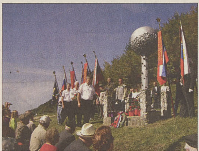
Delegaciji borcev in veteranov vojne za Slovenijo sta k spomeniku položili venec.

rodno osvobodilni boj ostaja v svetovni zgodovini neizbrisno svetel,« je dejal Türk in se dotaknil tudi poskusov njegovega prevrednotenja in povojne komunistične diktature. Po njegovem ni opravičila, da so eni svoj antikomunistični nazor izpričali s prisego okupatorju, kot ni opravičila za teptanje človekovih pravic v imenu komunizma. Ne moremo pričakovati recepta za enotno razumevanje vsake zgodovinske zgodbe, a na podlagi jasnih etičnih meril jih lahko vrednotimo in kaj tudi odpustimo. Zrela družba se ozira v prihodnost. »Spod-