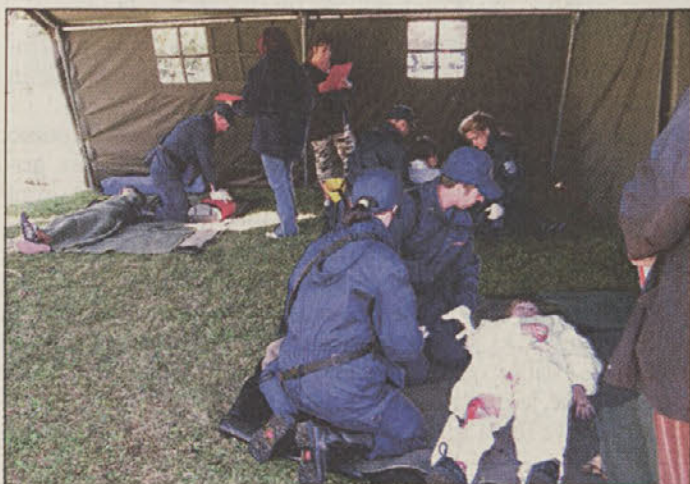
Kot bi šlo zares - eksplozija in udar električnega toka

Brežice - Minulo soboto je potekalo 13. regijsko preverjanje usposobljenosti ekip prve pomoči (PP) Civilne zaščite in Rdečega križa. Sodelovalo je sedem ekip in sicer ekipe PP občine Brežice, občine Krško in občine Sevnica, ekipa PP Nuklearne elektrarne Krško, ekipa PP Poklicne gasilske enote Krško, ekipa PP občine Hrastnik in ekipa PP Eti Izlake. Delo ekip so ocenjevali ocenjevalci-zdravniki in predavatelji prve pomoči ali medicinske sestre ter tehniki - učitelji praktičnega pouka prve pomoči. Med posavskimi ekipami so se najbolj izkazali »nuklearci«, ki bodo oktobra posavsko regijo zastopali tudi na državnem preverjanju v Novi Gorici. Na drugo mesto se je uvrstila ekipa občine Krško in na tretje ekipa Poklicne gasilske enote Krško. J.K.