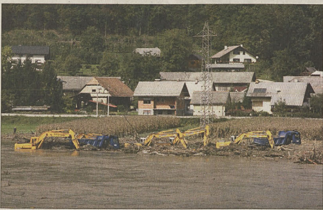
Potopljeni stroji na gradbišču HE Blanca

Sava, tako da je bilo potrebno zapreti cesto Gornje Brezovo-Sevnica, podvoz na Blanci in smer Poklek-Blanca - Brestanica. Z maksimalnim pretokom 2352 m 3 , izmerjenim na Vrhovem, Sava na srečo ni dosegla nivoja kot v poplavi leta 1990 in 1998, je pa iz polne