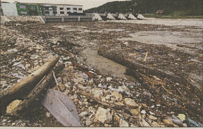
Naplavine pri HE Boštanj

struge voda butala v pritoke in na kritičnih točkah je prišlo do razlitja. Pretekle slabe izkušnje s poplavami so gnale ljudi, ki živijo ob vodi, v samozaščitno ravnanje. Na kri-