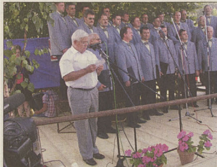
Slavnostni govornik Milan Kučan

delovanje oblasti. Kritična beseda namreč ne bi smela biti razumljena kot sovražno dejanje ali označena kot zarota namišljenih sil kontinuitete. Ko je govoril o predsedovanju naše države EU v prvi polovici prihodnjega leta, bo to naša