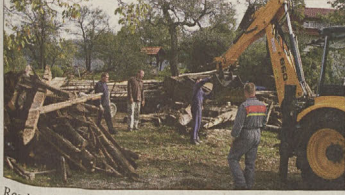
Razdejanje pri Trefaltovih na Metnem Vrhju