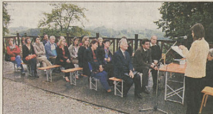
Ob odprtju Pleteršnikovih dnevov