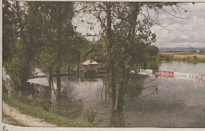
Športno-rekreativni center Grič je zalila Krka.