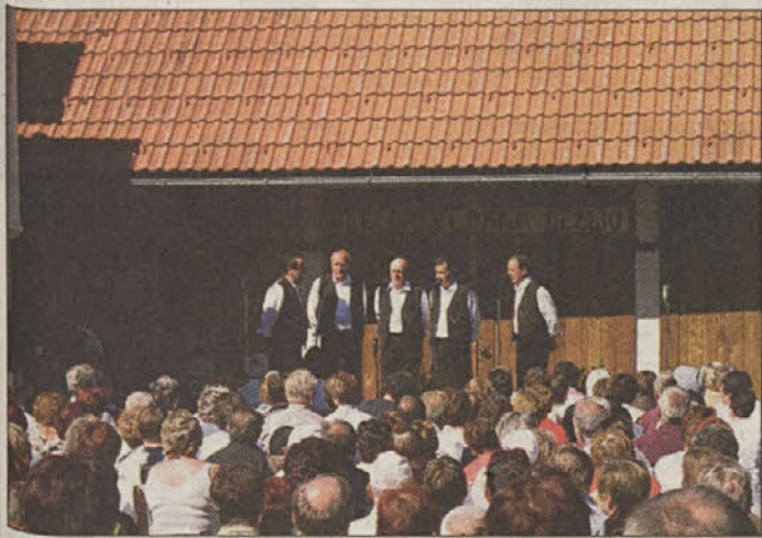
Fantje s Preske so 15. septembra nastopili tudi na gradu Rajhenburg, kjer je potekalo regijsko srečanje najboljših ljudskih Pevcev Dolenjske, Posavja in Bele Krajine.

Ob 6. srečanju ljudskih pevcev in godcev z naslovom »Zapojmo pr'jatlji« sta bili na kmetiji Hrovatovih na Preski na ogled tudi dve zanimivi razstavi. Klekljarsko društvo Cvetke iz Žirov je pripravilo razstavo čipk, razstavo sadja pa je prispeval Center biotehnike in turizma Grm - Novo mesto. N.Č.C.