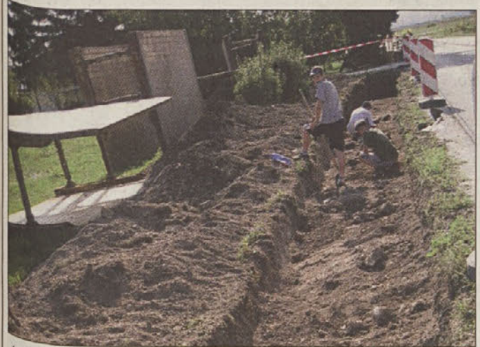
Arheoloska izkopavanja na Drnovem

V tem času je zgrajeno tudi že 860 m kanalizacijskega sistema, ki se pomika iz vasi Brege proti Drnovem. Tam so dela začasno ustavili zaradi arheoloških raziskav, ki so se začele sredi prejšnjega meseca. Območje pred Drnovim je namreč v Registru nepremičnin kulturne dediščine registrirano kot Arheološko najdišče Neviodunum.