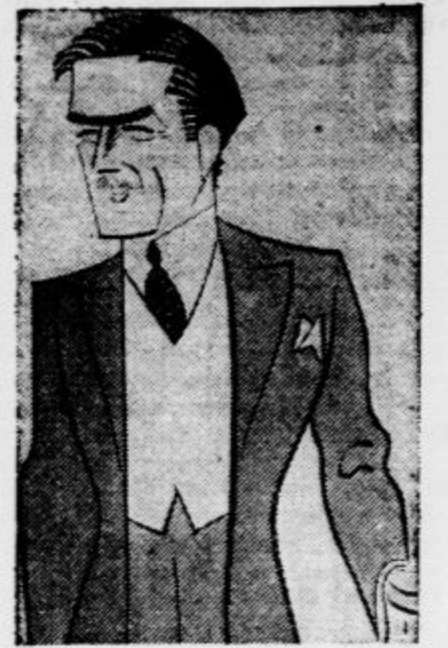
Angleški zunanji minister Eden je imel te dni v londonskem parlamentu govor, ki je močno odjednil posebno v Nemčiji in Italiji. Odklanjajoč rasno politiko, je povabil Nemčijo k skupnemu sodelovanju za blaginjo Evrope