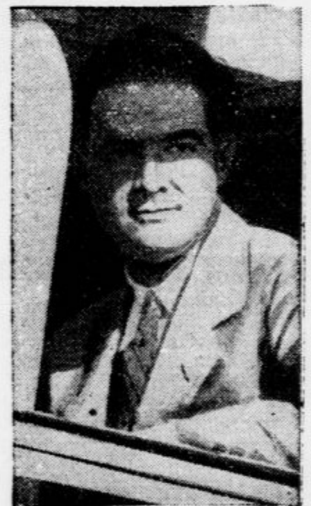
Ameriški filmski producent in letalec Howard Hughes je preletel s svojim enokrovnikom razdaljo med Los Angelesom in Newarkom, ki znaša 2420 milj, v rekordnem času 7 ur in 28 minut. Večinoma je letel v višini 4000 m. Polet je zbudil največjo pozornost zaradi brzine, kajti povprečna hitrost letala je znašala 534 km na uro