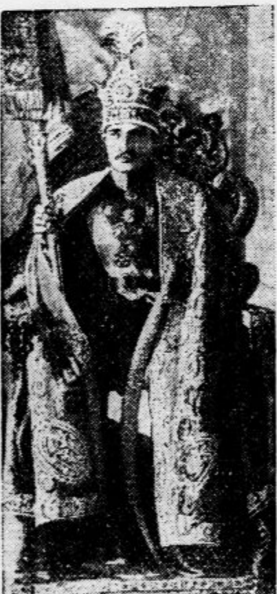
Perzijski šah Reza Pahlavi

Precejšnje presenečenje je zbudila te dni po svetu vest, da je perzijski šah odpoklical svojega diplomatskega zastopnika v Parizu in prekinil s tem diplomatske odnose s Francijo. Še bolj čudno je ozadje tega spora. Francoski uradni krogi stvari molčijo, kar je razumljivo s tega stališča, da jim je do tega, da bi nenavadno zadevo spravili čim prej s sveta.