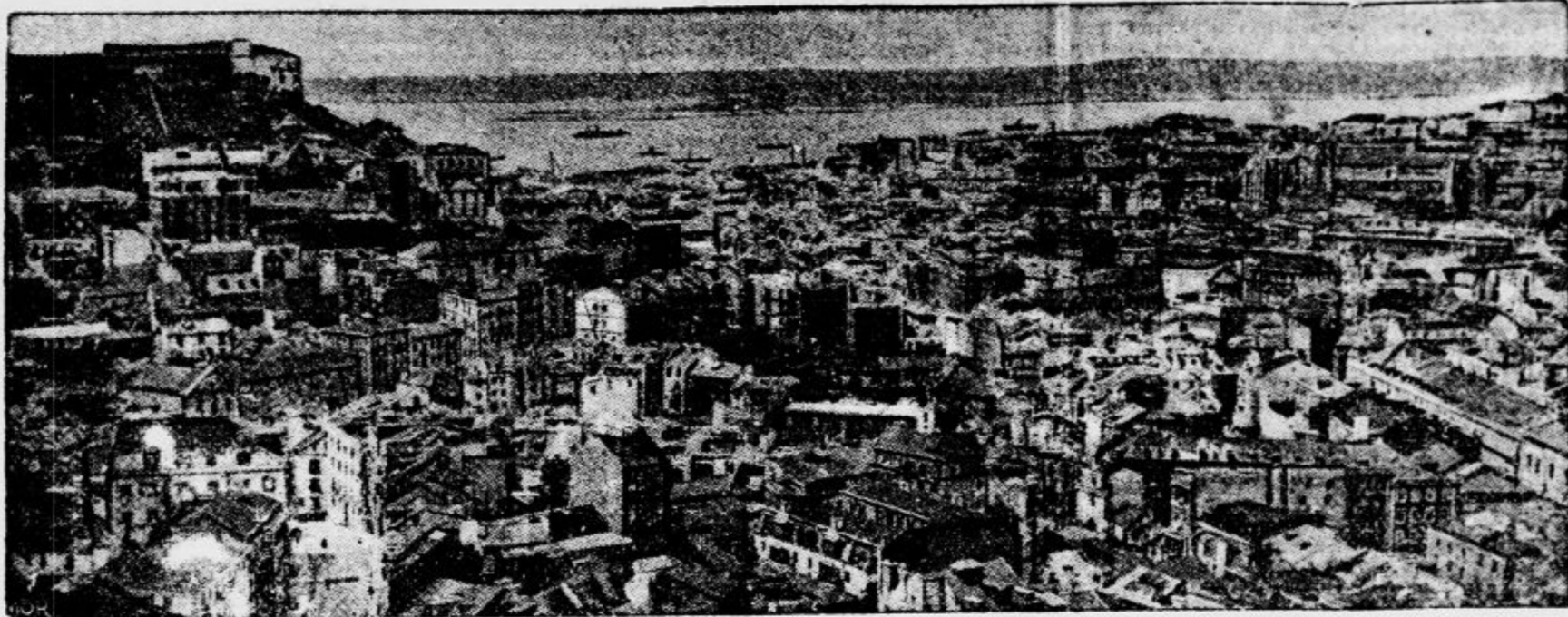
Fred bivšim španskim konzulatom v Lizboni, kjer zdaj posluje zastopnik generala Franca, so te dni ponoči eksplodirale bombe. Istočasno so se primerile eksplozije tudi v drugih delih mesta. Atentati so povzročili razumljivo vznemirjenje, ker sumijo, da gre za poskuse tujih agentov, da bi se tudi na Portugalskem zanetila državljanska vojna