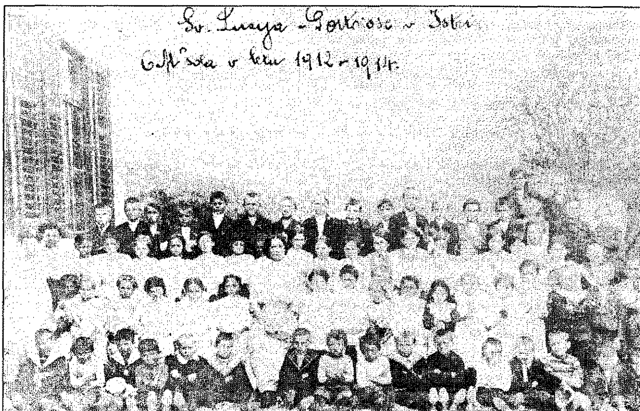
Učenci šole Društva Cirila in Metoda iz Sv. Lucije v letih 1912-1914.

Prva družbina osnovna šola s slovenskim učnim jezikom je bila ustanovljena 12. marca 1908 v Rakitovcu pri Buzetu. Proti koncu leta 1910 je bila ustanovljena šola s slovenskim učnim jezikom pri Sv. Barbari nad Miljami in je imela prvo leto 65, naslednje pa kar 77 učencev 38 . S preselitvijo slovenskega učiteljišča iz Kopa v Gorico in z ukinitvijo enorazredne vadnice so koprski Slovenci ostali brez svoje šole. V šolskem letu 1911/12 je bila zato odprta v Kopru zasebna šola istrske CMD 39 . Ob velikem nasprotovanju piranskih Italijanov je bila četrta slovenska šola CMD ustanovljena leta 1913 v Luciji pri Portorožu 40 .