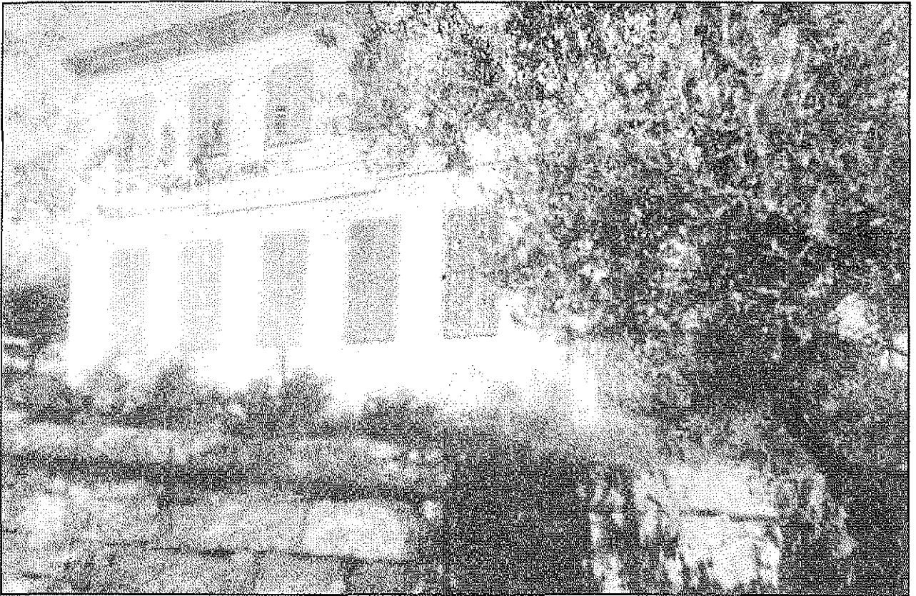
Šola v Krvavčah, ki jo je zgradila LN, 1906.