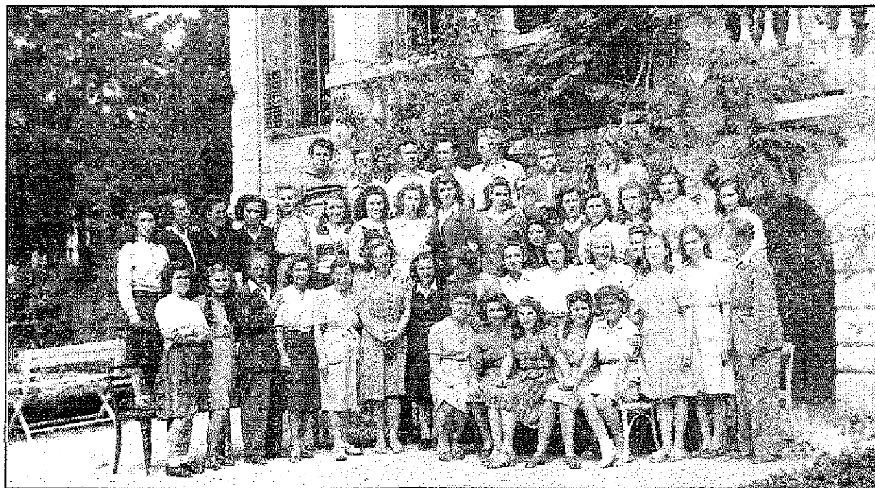
Dijaki in profesorji portoroskega učiteljišča v sol. letu 1947/48 (foto: M. Marušič, 1948).

Slovenski jezik ponovno zaživi v partizanskih šolah takoj po kapitulaciji Italije; to so začetki obnavljanja slovenske šole, odpravljene z znano reformo. Partizanske šole so nastajale, kjer je bilo le mogoče in kjer so le dopuščale vojne razmere. Njihovo delo je izhajalo iz dnevnih potreb osvobodilnega boja; te šole so v slovenski zgodovini šolstva pojav brez primere, ko se šolski program sklada z življenjem, ko je šola odsev dnevnega življenja. Popolno obnoveitev slovenskih osnovnih šol, tudi z vidika programske celovitosti, smo doživeli po osvoboditvi oktobra 1945. Takrat so bile obnovljene osnovne šole povsod in z vsemi značilnostmi.