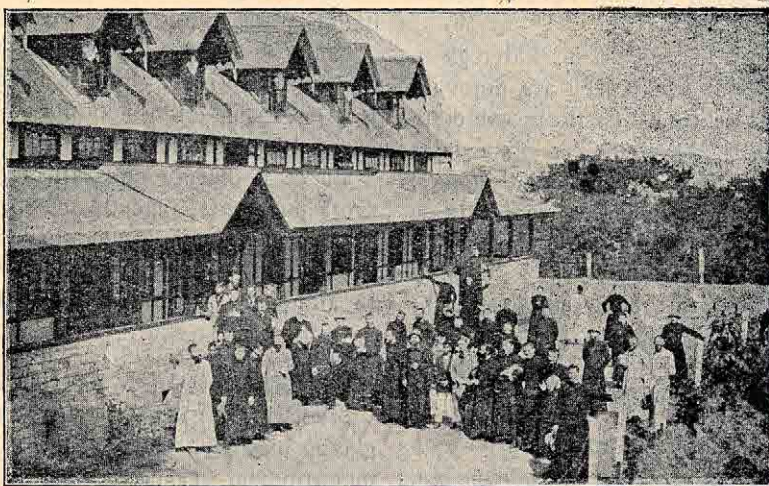
Assam (Indija). Salezijanska, misijonska hiša v Shillongu.

Nekega lepega dne pred štirimi leti so pa vsi boji kar hipoma utihnili in vsi ti bivši sovražniki so se združili in strnili v