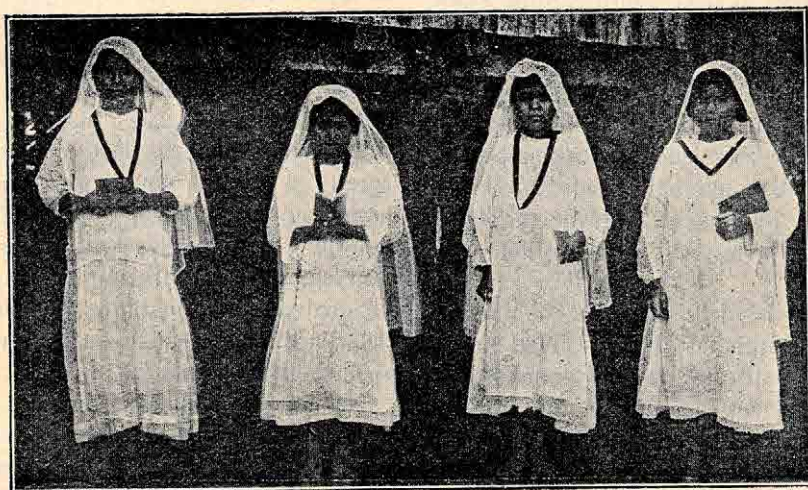
Štiri Hivarke, ki pristopijo k sv. obhajilu skoro vsak dan.

Tako sem Vam opisal tri vrste čič. Vse služijo v to, da si ljudje z njimi gasijo žejo