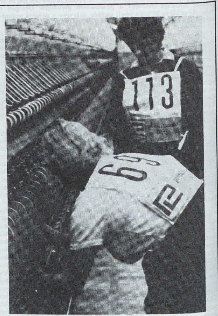
☆☆☆ Hitre, spretno roke vežejo pretrgane nitke. ☆☆☆