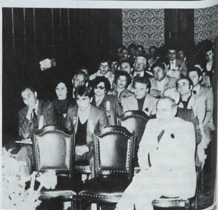
Organizacijski sestanek predstavnikov ekip in sodnikov na gradu Bogenšperk v Valvazorjevi knjižnici. Tam so izžrebali tudi startne številke.