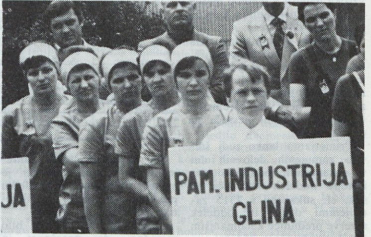
Zmagovita ekipa iz Gline.