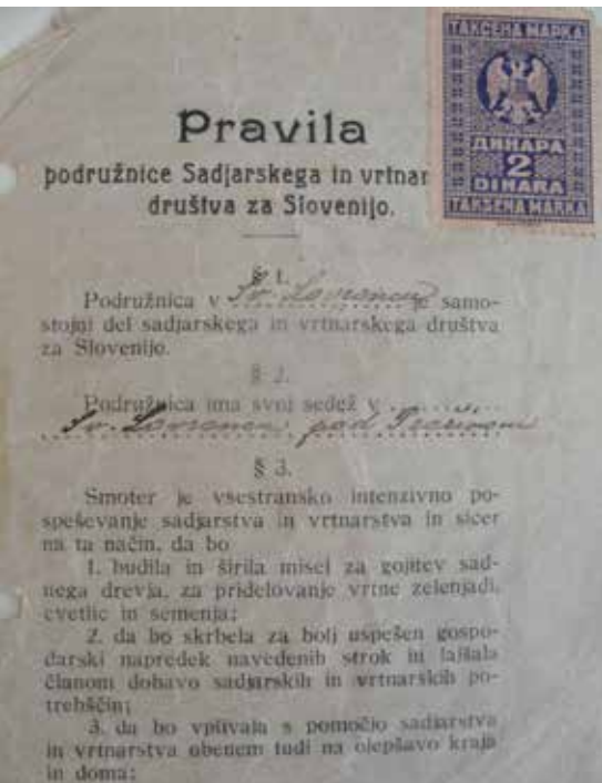
Pravila Sadjarskega društva