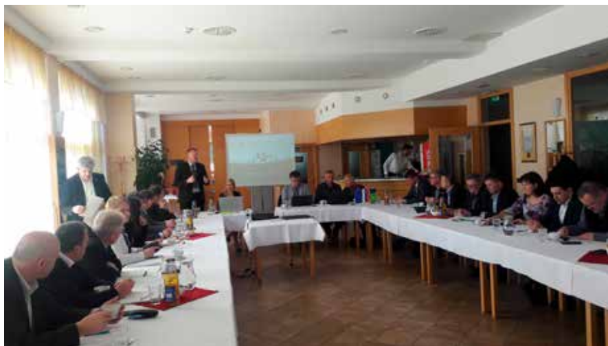
Dogodek na Domu na Svetini

Meseca februarja 2019 je bila Občina Štore gostiteljica dogodka, katerega organizatorji so bili Občina Štore, podjetje Simbio d.o.o. in Direkcija RS za infrastrukturo. Na dogodku, ki je bil na Domu na Svetini, so bili prisotni župani občin, ki imajo za kolesarske povezave rezervirana evropska sredstva v okviru Dopolnitve št. 1 k Dogovoru za razvoj Savinjske razvojne regije (DRR). Gre za 157 km kolesarskih povezav, katerih ocenjena vrednost je 36 mio €. Rok izgradnje je leto 2023.