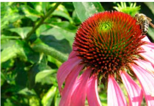
Slika 1: Ena od medovitih rastlin je ameriški slamnik.

To je odvisno od tega, kaj imamo na razpolago: ali je to balkon, na katerem imamo cvetlična korita, je to morda vrt ali njiva ali pa so to javne površine.