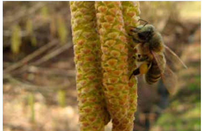
Slika 2: Leska – medoviti grm, ki nas jeseni razveseljuje s svojimi plodovi – lešniki.

Za cvetlična korita na balkonu imamo številne možnosti pri izbiri medovitih rastlin iz vrst začimbnic in dišavnic. V korita lahko sadimo baziliko, origano, timijan, meliso, boreč, pa tudi nizko sončnico ali ameriški slamnik in še bi lahko naštevali.