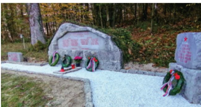
Spomenik na Frati po obnovi

Da pa bi se ohranil spomin na dogodka pred 79 leti, je pri obnovljenem partizanskem spomeniku na Frati ob spoštovanju vseh omejitev zbiranja potekalo polaganje vencev v spomin na padle partizane, aktiviste NOB in ubite talce. Med njimi so bili tudi lovci. Spomenik je leta 1952 v spomin svojim lovskim tovarišem in drugim domoljubom, padlim na tem območju,