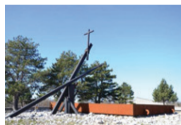
Prazna bazoviška fojba

Ljubljana je bila edino mesto v Evropi, ki je bilo obdano z bodečo žico, dolgo 26 kilometrov, in številnimi stražnimi stolpi. Kdaj se bo italijanski predsednik poklonil trpljenju in smrti tisočernih Primorcev, talcem v Gramozni jami, uničenim vasem in ne nazadnje uničenemu gospodarstvu Primorske in Slovenije?