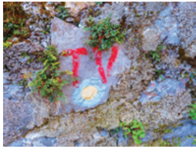
Markacija Poti kurirjev in vezistov

Od spomenika do Ravnega Dola se markacijam Poti kurirjev in vezistov pridružijo še Knafeljčeve mar-