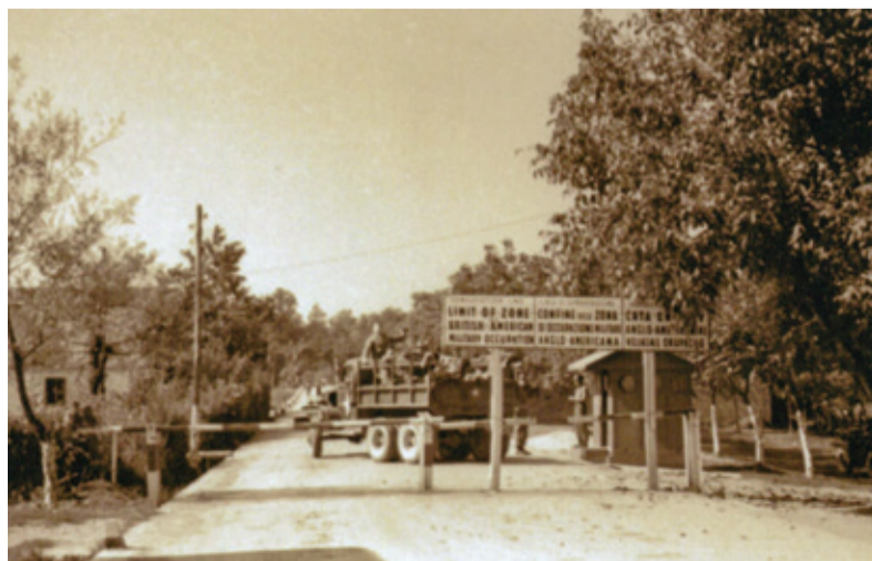
Razmejivna linija med cono A in B na dan odhoda anglo-ameriških vojakov 16. septembra 1945 na Ajševici pri Novi Gorici