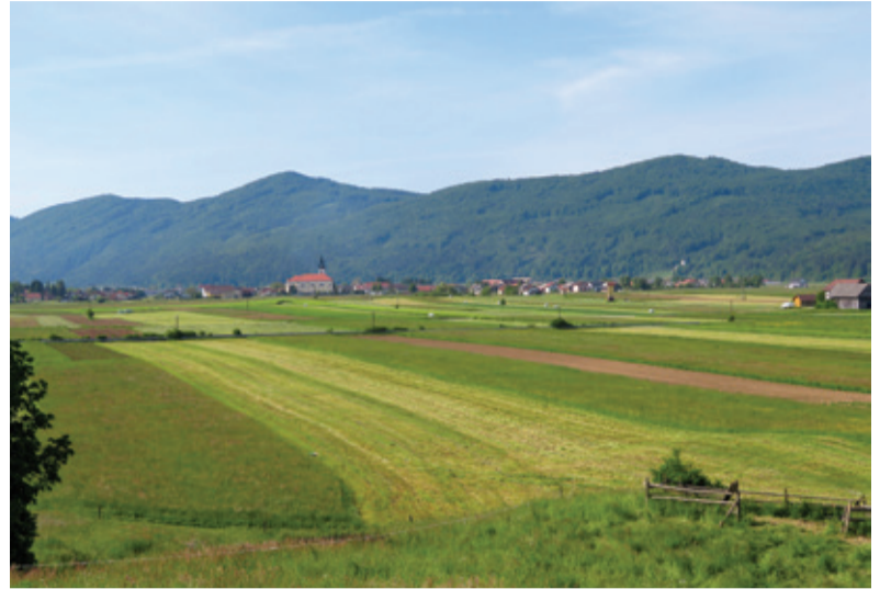
Na poti je veliko izjemnih pogledov na dele lepe Slovenije.

Po treh urah hoje bomo prišli do druge kontrolne točke z žigom, ki je