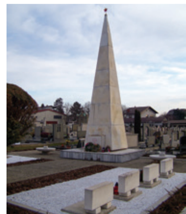
Urejeno spominsko obeležje na murskosoboškem pokopališču

Mestna občina Murska Sobota se je odločila, da bo preuredila spominsko obeležje padlim za svobodo na murskosoboškem pokopališču. Dela pri preureditvi so bila zaupana Javnemu komunalnemu podjetju Murska Sobota. Po več letih je zob čas načel spominsko obeležje, zato je bila preureditev več kot potrebna. Soboško pokopališče pa je eno najlepših daleč okoli. Tako so najprej opravljenimi deli odstranili in zamenjali stare robnike, ki so bili povsem dotrajani, pogreznjeni in okrušeni ter razpokani. Vsa na-