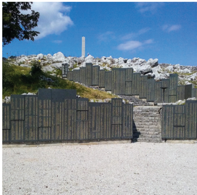
Spomenik padlim borcem NOVJ in žrtvam fašističnega nasilja iz občine Nova Gorica na Trnovem

Zadnji konec tedna v juniju 1965 sva šla z ženo Cveto na morje v Pineto pri Fažani v Istri. Med Skopim in Dutovljami na Krasu se mi je vespa pokvarila, in ker je svečka prevajala elektriko, sem sklepal, da je električni kabel nekje pretrgan. Vespo in ženo sem pustil pri bližnjem češnjevem drevesu, sam pa sem se peš napotil proti Dutovljam. Po nekaj kilometrih mi je na kolesu prišel naproti možak s škropilnico na hrbtu. Ustavil sem ga z vprašanjem, ali je v Dutovljah kakšen mehanik, ki bi premogel primeren kabel za vespo. Možak mi je povedal zanj in mi še ponudil svoje kolo. Na mojo pripombo, kako si meni neznancu upa takoj ponuditi kolo, je odgovoril, da imam pošten »fris«. Med kolesarjenjem proti Dutovljam si nisem bil na jasnem, kako da je