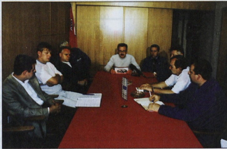
Vodstvo SKEI v Tamu je na tiskovni konferenci opozorilo, da v številnih podjetjih na lokaciji nekdanjega Tama kršijo delavske pravice.

Z resnimi težavami se srečujejo tudi delavci v podjetju Prosecurity. Gre za bivše podjetje MPP-STP, ki ga je Slovenska razvojna družba po Gajzerjevih besedah prodala neodgovornemu lastniku, ta pa naprej podjetju Sintal. V začetku januarja je sindikat z novim di-