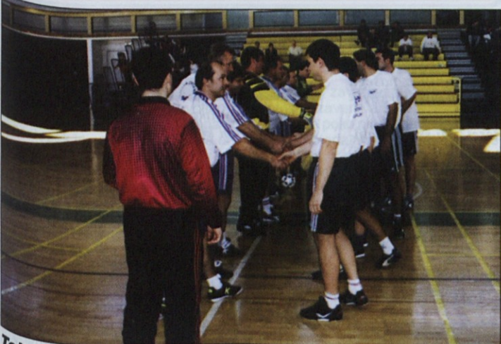
Tekmovanje je potekalo v športnem in prijateljskem vzdušju.