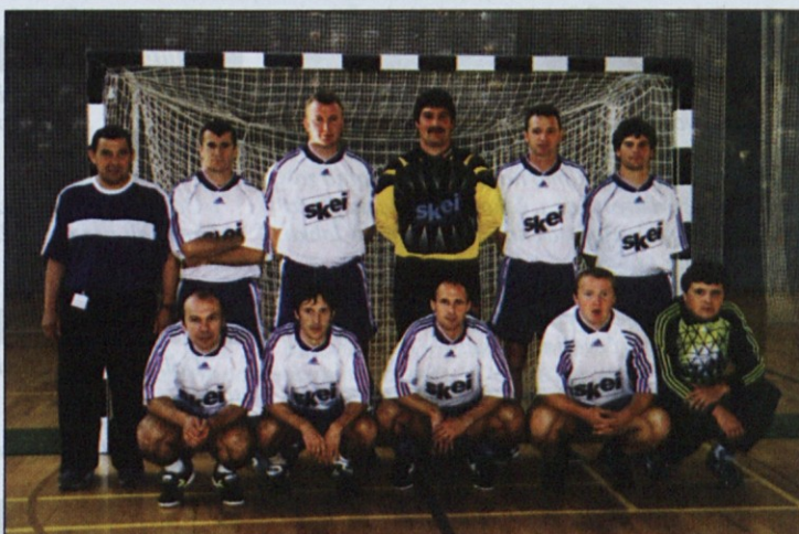
Prvo mesto je osvojila ekipa, ki je zastopala območno organizacijo SKEI v Celju.