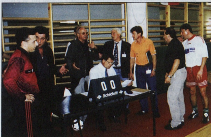
Ob sodniški mizi je včasih v žaru tekmovanja prišlo tudi do vročih razprav, ki pa niso pokvarile tovariškega razpoloženja.