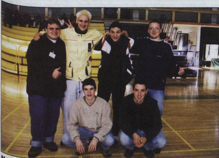
Na prvenstvu je sodelovala tudi ekipa SKEI - mladi, ki je nastopala izven konkurence.