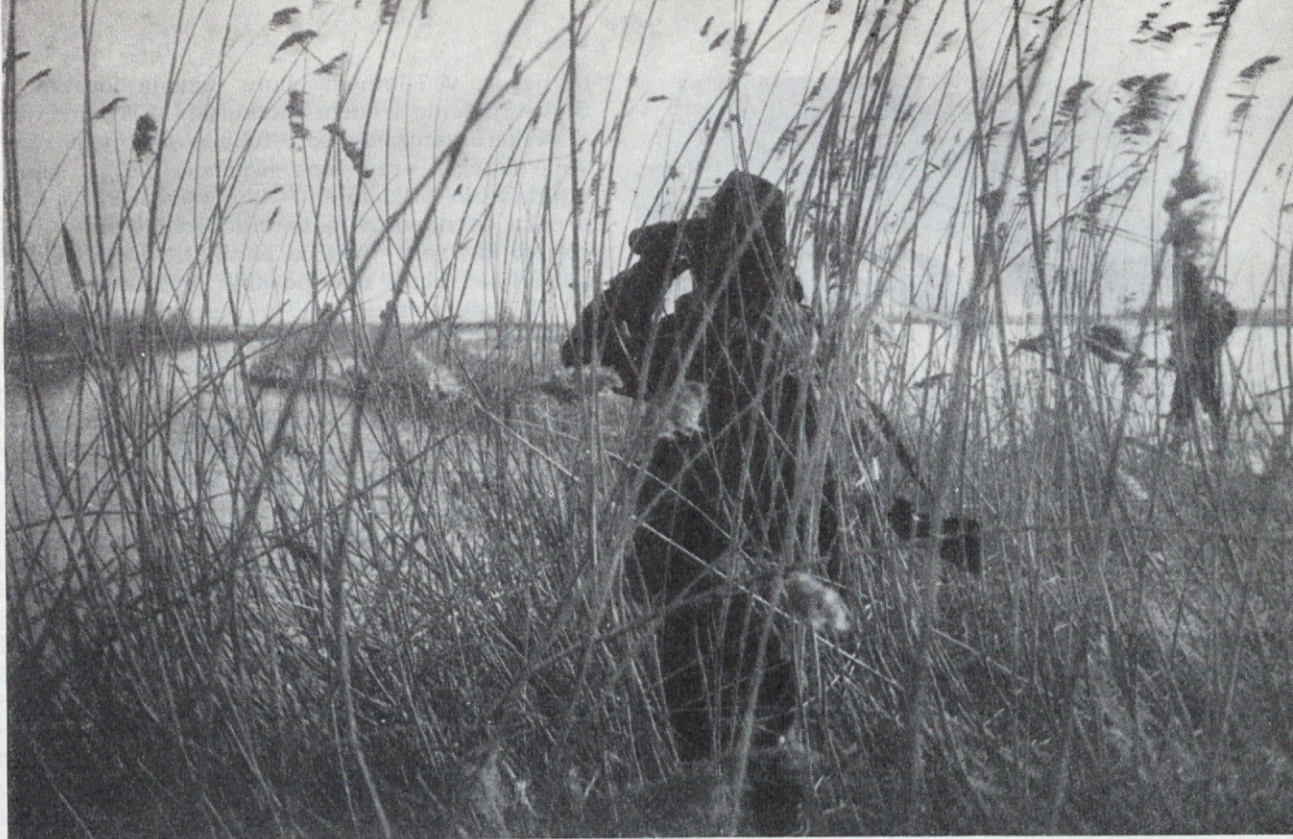
Na Cerkniškem jezeru