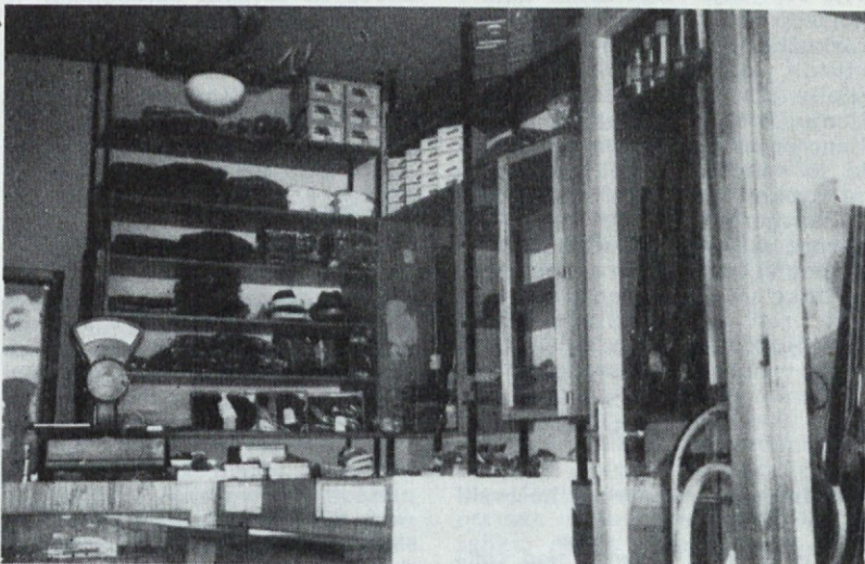
Trgovina v lovskem domu LZ Gorica