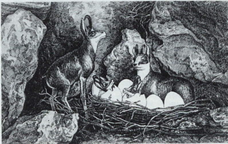
Gamsi, ostanek iz terciarne dobe; ležejo se iz jajc kakor avstralski kljunaši