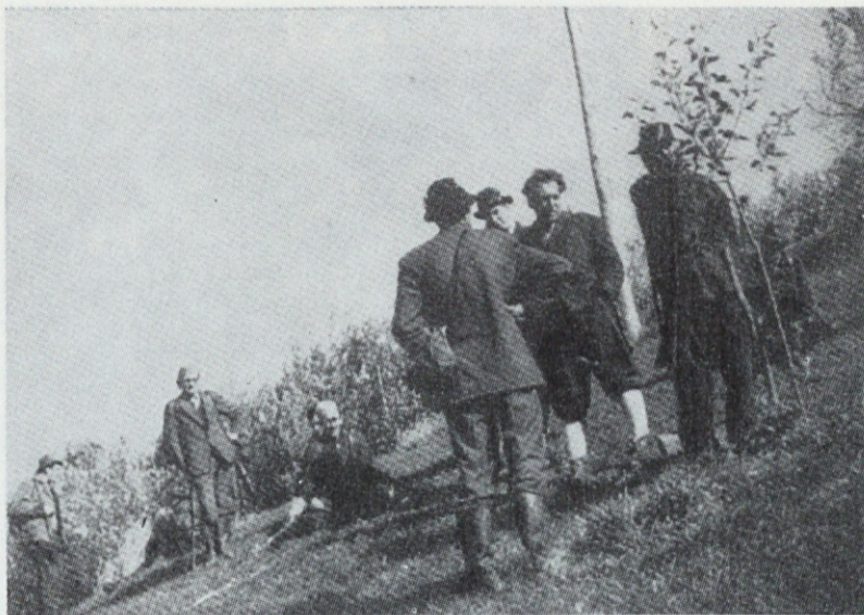
LD Laze — v odmoru

V samih lovskih organizacijah je večkrat opaziti različne prepira želne lovce, ki na netovariški