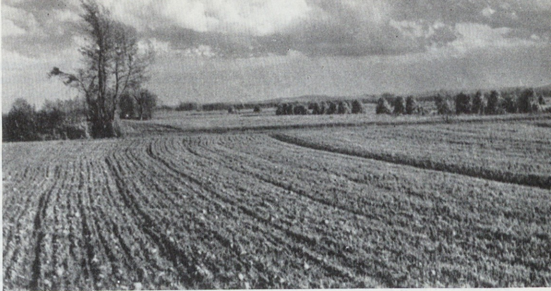
Lovišče LD Križevci