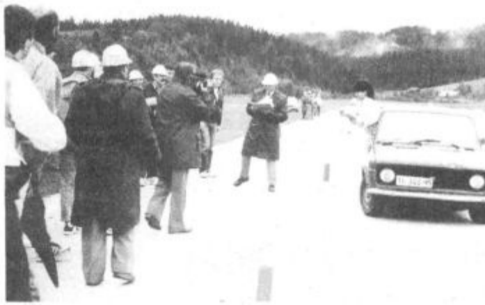
Na pot so v dežju in mrazu krenili izpred Rdeče dvorane Najzahtevnejša in obenem najbolj zanimiva spretnostna preizkušnja je bila na letališču v Lajšah

Poglejmo še rezultate. Skupni vrstni red: 1. Titovo Velenje 60 točk, 2. Titograd 49, 3. Titova Mitrovica 38, 4. Titov Vrbas 36, 5. Titovo Užice 24, 6. Titov Drvar 10 in 7. Titov Veles 5; v kategoriji do 1.200 ccm sta prvo in drugo mesto osvojili posadki iz Titove Mitrovice, četrta pa je bila velenjska posadka Detela —