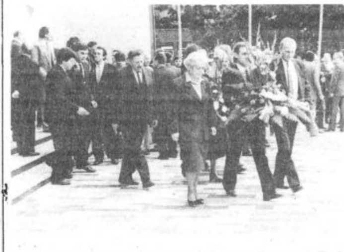
Ob koncu slovesnosti so delegacije položile cvetje k Titovemu in Kardeljevemu spomeniku ter k spomeniku Onemele puške.