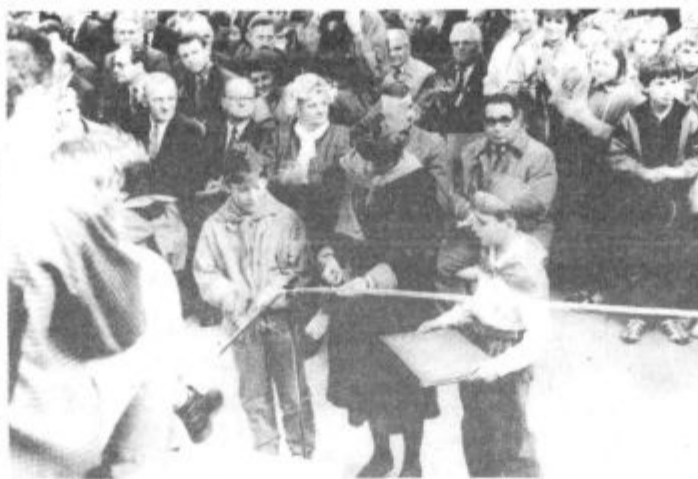
Nove osnovne šole so se seveda najbolj razveselili učenci, ki so jo tudi predali namenu

Prepričani smo, da je nadaljnji stabilnejši razvoj v SFRJ možen le ob enakopravnosti, medsebojnem spoštovanju in večji motiviranosti za ustvarjanje vseh, ki tu živimo. Za tako pot razvoja smo se v medsebojnem sodelovanju zavzemali dosedaj in se bomo tudi v bodoče.»