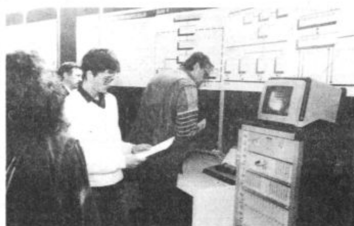
Gorenje Procesna oprema je predstavila več novosti s področja profesionalne elektronike