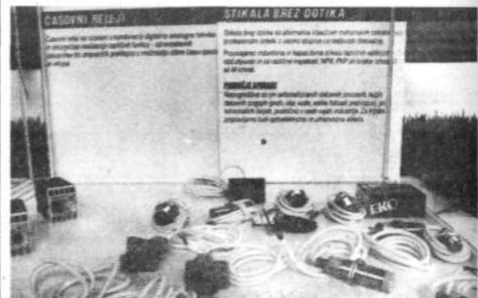
Brezkontaktna stikala Gorenje EKO so zanimiva tudi za tuje trge

ne elektronike in strojništva v enotno računalniško podprto procesno opremo, je v Ljubljani predstavila robot Stefan 130 s Krmilnikom Gorenje K 103 za točkovno varjenje, dva prostoprogramirna sistema za vodenje tehnoloških procesov v industriji — KUP 2000 in KUP 2000 M,