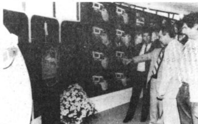
Gorenje Elektronika Široka potrošnja je obogatila paleto barvnih televizijskih sprejemnikov

strateških sistemih, vse pomembnejše mesto.