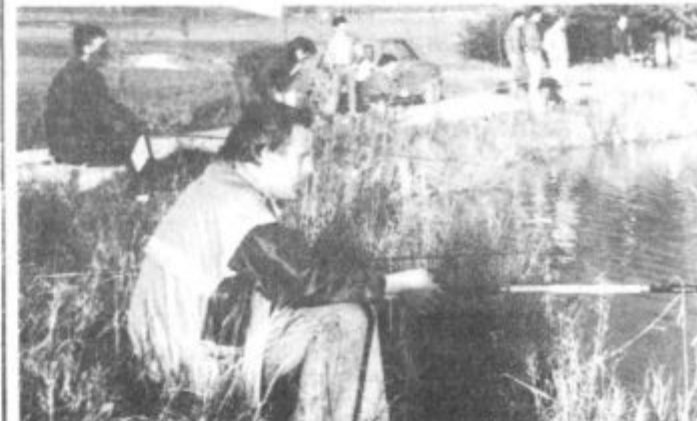
Veliko jih je prišlo ob škalsko jezero in še več bi jih bilo, če ne bi dopoldne tako deževalo