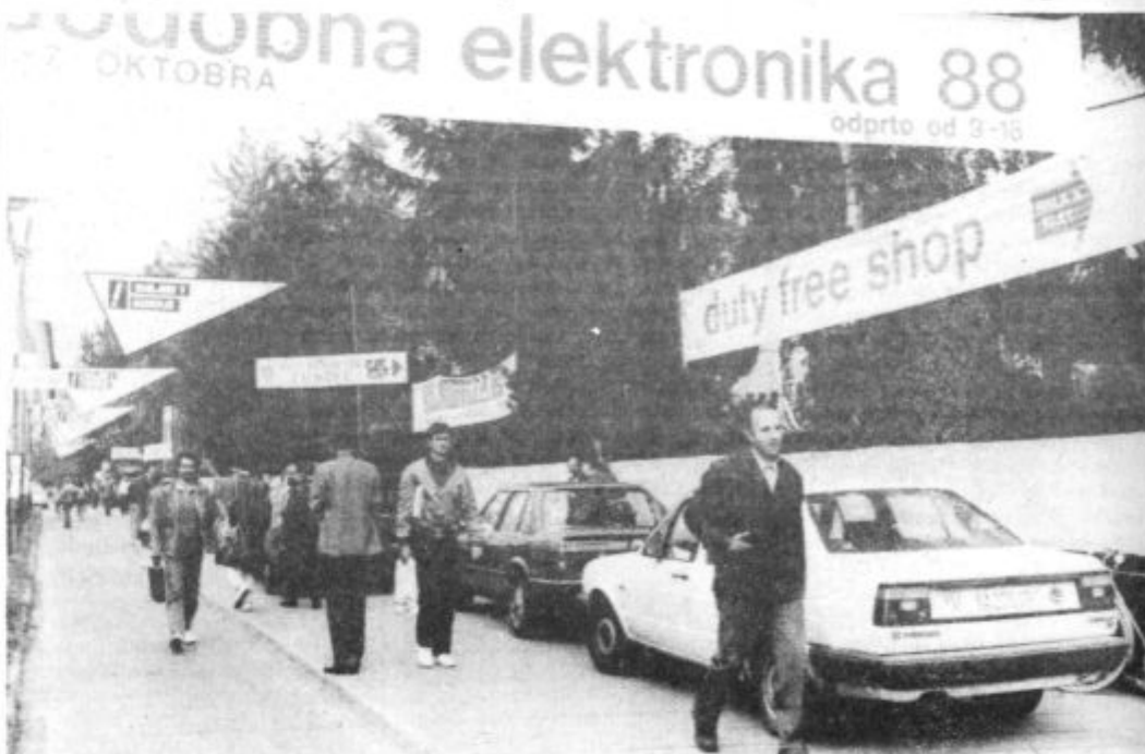
Mednarodno razstavo »Sodobna elektronika '88« si je v petih dneh ogledalo 60.000 obiskovalcev, domačih in tujih

Na že tradicionalni časnarski konferenci so predstavniki Gorenja povedali, da sicer predstavlja ta poslovni sistem dosežke in razvojna hotenja vsako leto na številnih sejnih doma in na tujem. Sodelovanje na ljubljanski »Sodobni elektroniki« pa je tudi za Gorenje posebnega pomena. Elektronika zavzema namreč v vseh poslovnih področjih, tako imenovanih integralnih