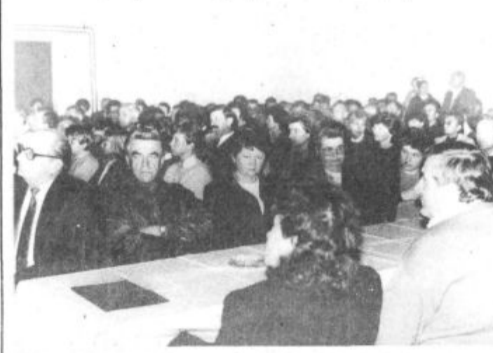
Krajanje Konovega so do zadnjega kotička napolnili dvorano tamkajšnjega doma krajanov in se upravičeno veselili nove pridobitve