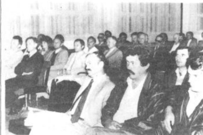
S svečane seje skupščine krajevne skupnosti Šoštanj

Ob koncu svečane seje skupščine krajevne skupnosti Šoštanj