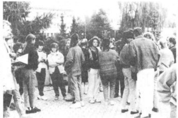
Dijaki Centra šol iz Titovega Velenja so 44 gostom iz pobratene srednješolskega centra Vrnjačka Banja pripravili vrsto aktivnosti

Z lepimi vtisi in spomini so se v nedeljo zjutraj vrnili na svoje domove. Velenjčani jim bodo ta obisk vrnili maja prihodnje leto.