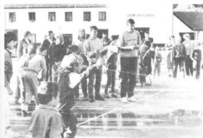
Otrokom vse najboljše