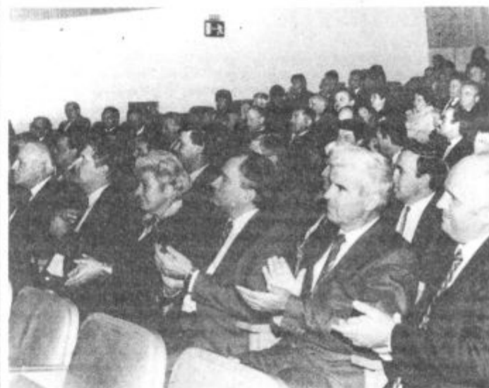
Svečanega zasedanja občinske skupščine so se udeležili številni gostje iz republike, sosednjih in pobratenih občin.