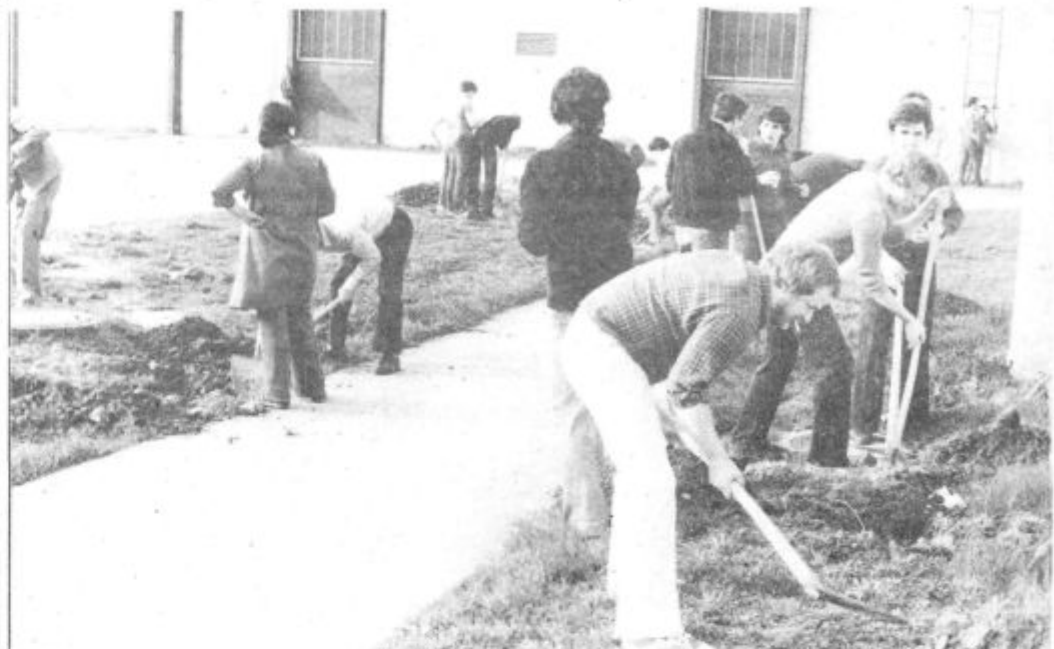
V krajevni skupnosti vsak dinar trikrat obrnejo in ga nekajkrat oplemenitijo z udarniškim delom

V Ravnah so uresničili vse zadane naloge, razen razširitve te-