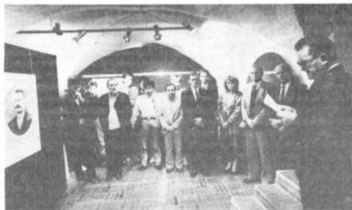
Z otvoritve razstave