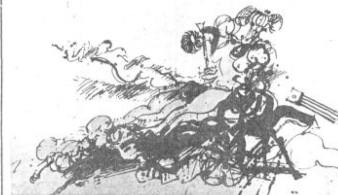
Iz mape: »Noč meduz«