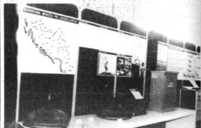
Na razstavi je sodeloval tudi Gorenje Servis