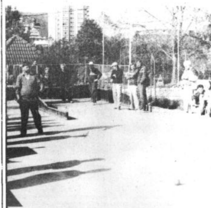
Tradicionalnega regijskega balinarskega turnirja v počastitev občinskega praznika se je udeležilo 12 ekip

Na 4. mesto se je uvrstila ekipa društva upokojencev iz Titovega Velenja.