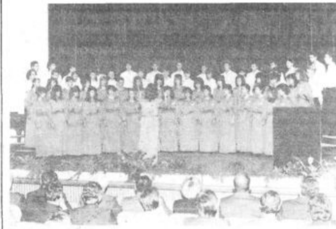
Slovesno zasedanje skupščine je z nekaj pesmimi popestril pevski zbor Centra srednjih šol