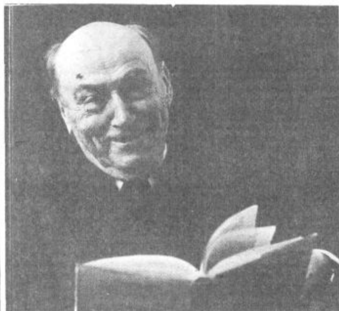
Dr. Anton Trstenjak