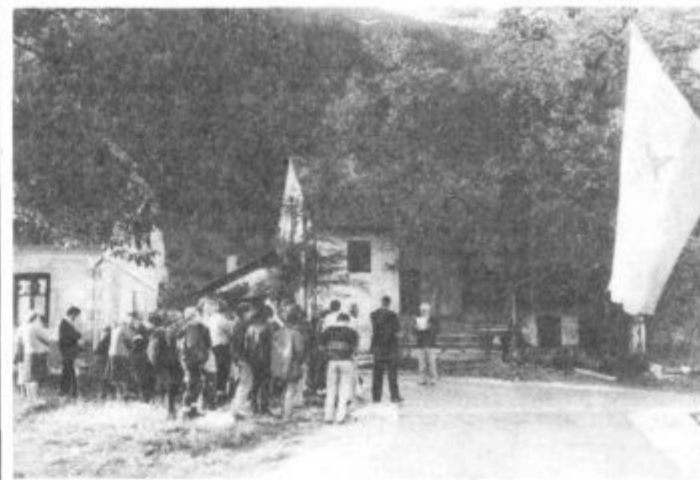
V prijetnem zaselku Dol so upravičeno veseli in srečni

pravljajo na ponovitev, program so že izdelali in prepričani so, da bo ponovna odločitev krajanov uspešna. Zavedajo se, da je to predpogoj nadaljnjega razvoja te krajevne skupnosti, ki mora naprej v korak s časom in tudi vse