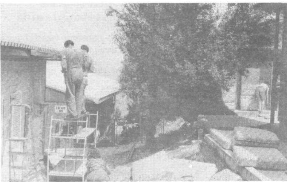
Delavca, ki sta nameščala nove žobove, sta se znašla – postelja na posteljo je lestev. Tovarišice iz vseh letošnjih izmen v Pacugu so prijelo v roke iztepeče in očistile jogi vzmetnice.