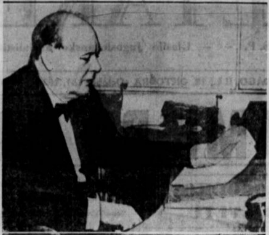
Na sliki je Winston Churchill, minister angleške vojne mornarice in politično najvplivnejši član kabineta, ki je v svojem govoru v radiu izjavil, da je Hitler v vojno pričel, a skončali jo bosta Anglija in Francija po njenih, ne po Hitlerjevih pogojih.