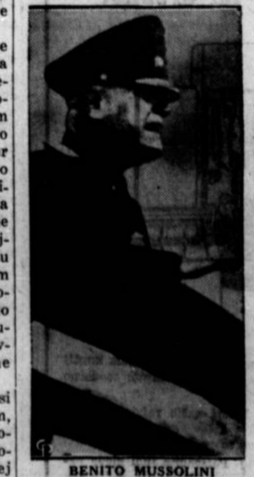
BENITO MUSSOLINI obvezan, da mu mora prisločiti na pomoč čim bo Nemčija napadena. To se je zgodilo, a Italija je še zmerom nevtralna. Kakor zadnjič, tako tudi sedaj čaka, kje je več priložnosti za zmago in več prilike za plen.

Kaj stori Mussolini? Zdad je nevtralen. V pogodbi s Hitlerjem pa je