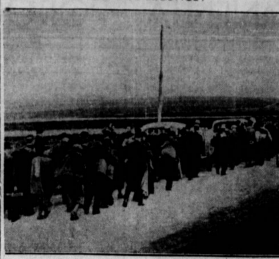
Vojna na Poljskem je po berlinskem in moskovskem zagotovu končana, toda ne za begunce. Kakih sto tisoč jih je v Rumuniji, na tisoče jih je izlo preko meje na Madžarsko, vrh tega pa so veliki tabori beguncev na Poljskem samem. Tisoči izmed njih se nimajo kam povrniti, bodisi, da so jim naciji ali pa komunisti zaplenili kmetije, ali pa so ob službe, katere so imeli pod poljsko vlado. Več milijonov Poljakov si mora samo v nemškem delu okupirane Poljske poiskati nove domove in službe. Ker jih ni, žive natrpani v begunskih taborih, tarnajo, nasledujejo jih bolezni in stotine jih pobira smrt. Na sliki je procesija beguncev, ki je utekla pred prodirajočo nemško armado v Rumunijo.