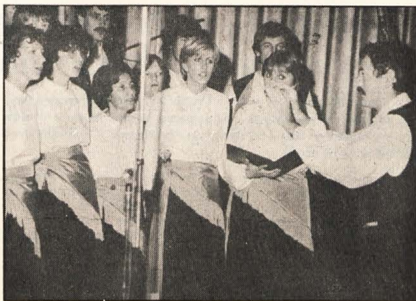
Pevski zbor SPD „Rož“

MI IN KULTURA — MI IN KULTURA — MI IN KULTURA — MI IN KULTURA —