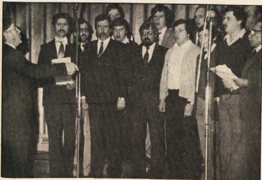
Moški pevski zbor SPD Radiše

priveditev je dejansko bila drugačen pristop k pripravi sporeda oz. njegovi vsebinski izpovedi. To se je videlo že po postavitvi sodelujočih, katerim ni bilo treba izmenoma hoditi na oder. K temu je pripomogla tudi odločitev, da v spored niso vključili masovnih skupin, tako je domala potekalo brez