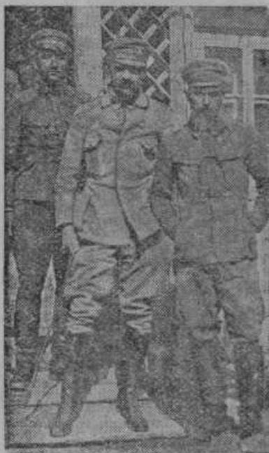
Na sliki iz svetovne vojne vidimo rajnega poljskega maršala Piłsudskega (na sredi), sedanjega maršala Smigły Rydza (desno) in poljskega vojnega ministra Kasprzyckiego. Fotografija je iz leta 1915