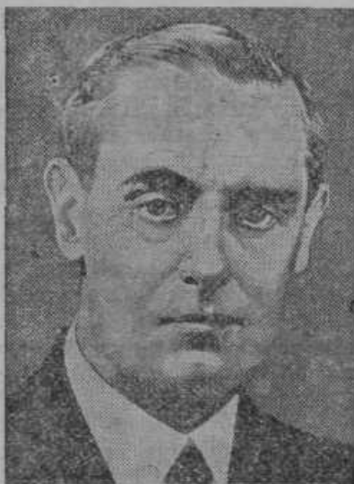
Angleški lord Linlithgow, indijski podkraj, je sklenil, da bo podaljšal poslovno dobo sedanjega indijskega parlamenta za eno leto