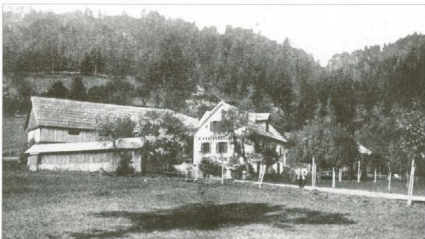
Gruf aus Suhidol bei Windische a.