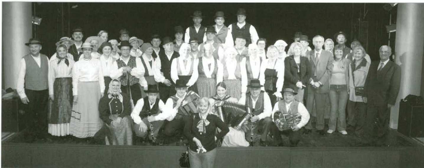
Naši s predstavniki Slovenskega KD Triglav iz Splita