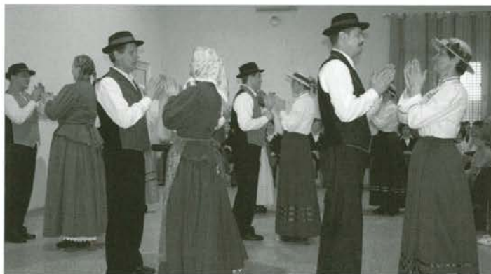
FS Dravca Dravograd

Po dveh dneh druženja in gostovanja folklorne skupine s Koroške na Hrvaškem, nas je tretji dan pot popeljala proti domu. Vtisi z gostovanja so zelo pozitivni in upamo, da bomo še kdaj združili moči in se odpravili skupaj po Sloveniji ali tudi izven naših meja.