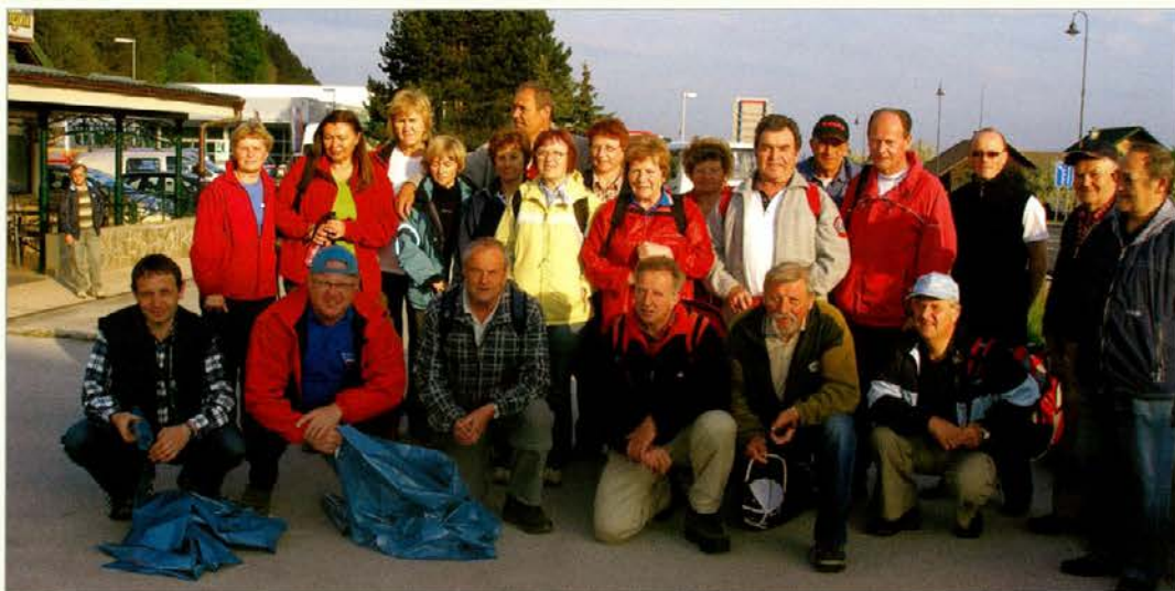
Skupinski posnetek planincev pred pričetkom čiščenja v Mislinji

območju. Tako smo se razdelili v več delovnih skupin: prva je prevzela čiščenje poti iz Mislinje do Črnega vrha in Ribniške kočje, druga se je podala na pot, ki vodi iz Dovž do Grmovškovega doma, tretja jo je ubrala po poti iz Mislinje na Roglo, četrta pa se je lotila čiščenja krožne poti iz Mislinje na Črepič in Završe. Naj na koncu navedemo še to, da nobeden od aktivistov, za opravljeno delo ne dobi nikakršne denarne nagrade, edino »plačilo« jim je zagotovljena malica po zaključku akcije.