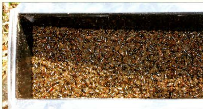
Prvi majski ulov lubadarjev