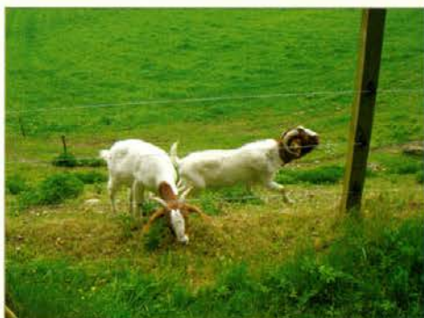
Svobodne za ogrado