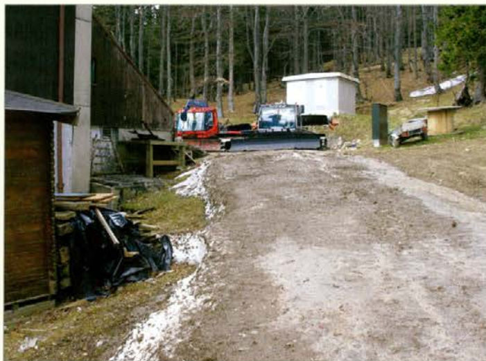
Takole je videti okolica Grmovškovega doma po končani smučarski sezoni.

Sicer pa smo planinci v soboto očistili domala vse markirane planinske poti na našem