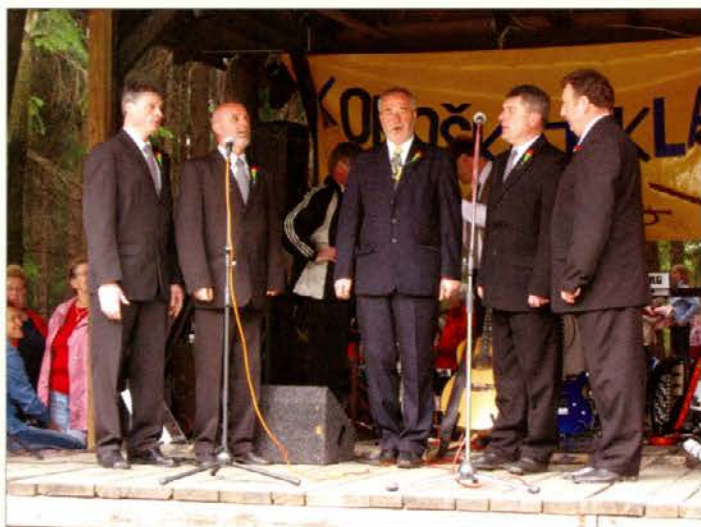
Kvintet Ajda na Ivarčkem jezeru