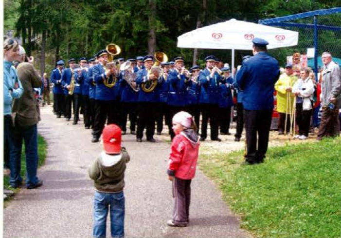
Ravska godba na Ivarčkem jezeru