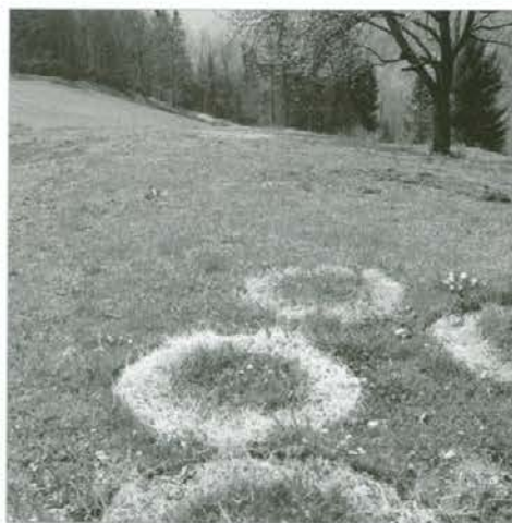
Sledi vesoljcev ali traktorskih gum v Platu nad Mežico? (28.4.2008)