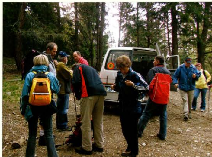
Pri čiščenju so nam pomagali slovenjgraški planinci. Očiščevalna akcija