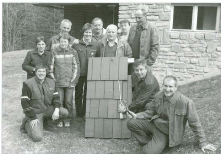
„Karbellov“ Tija je pokazal streho iz deščic