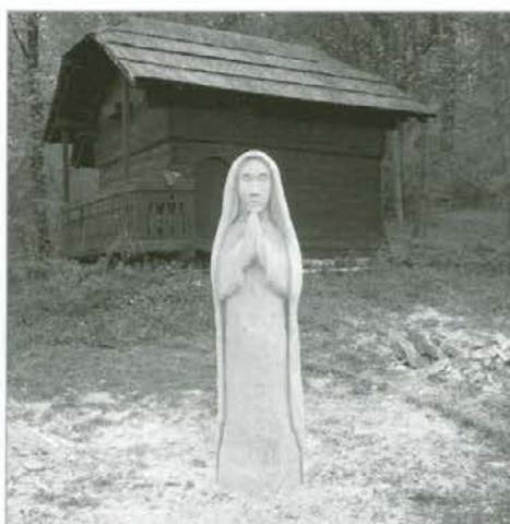
Lesena skulptura pred kaščo na robu ravenkega parka