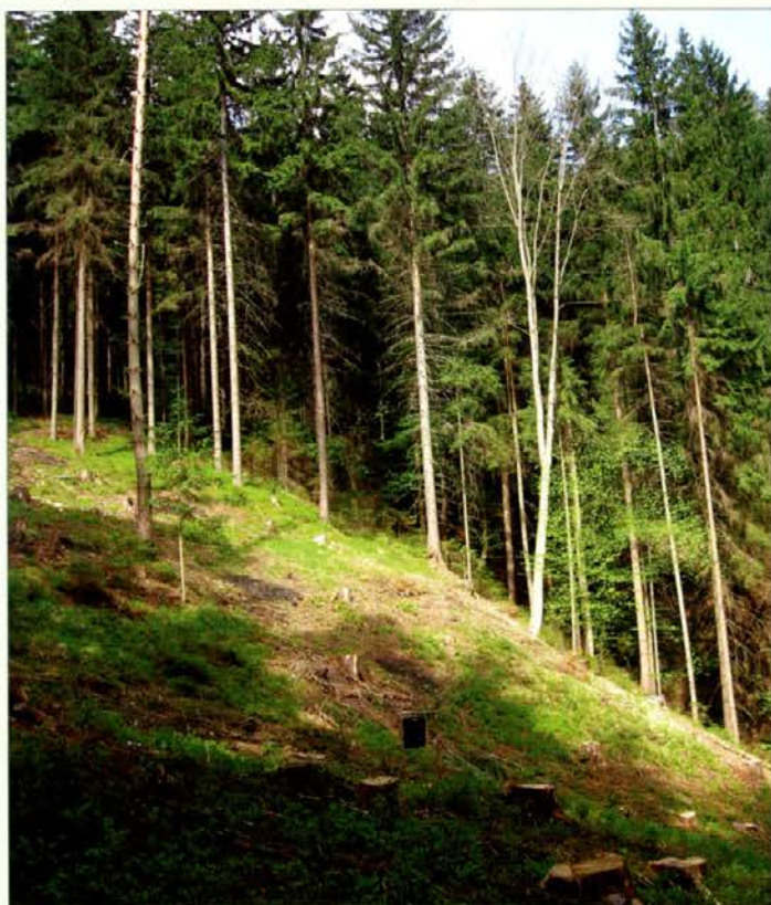
Urejeno žarišče lubadark

V Sloveniji se sečnje iglavcev zaradi podlubnikov zadnja leta prekomerno povečujejo, tako v območju Slovenj Gradca kakor tudi v Krajevni enoti Dravograd. OE Slov. Gradec s svojimi