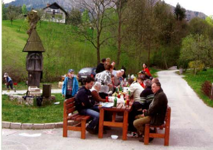
Praznovanje 1. maja v Podkrajju