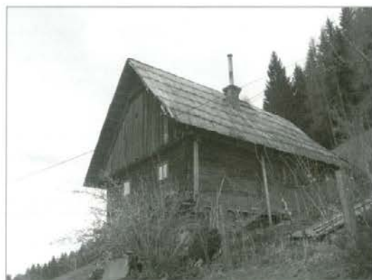
Modrejeva bajta na Pernicah