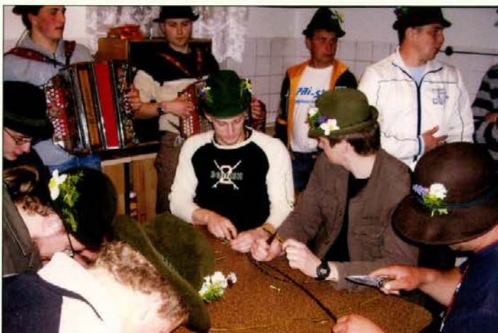
Koledniki iz zgornjega Razborja

slovljen). Lepo se poslovijo od domačih in še zapojó. Pesem govori o sv. Florijanu, ki naj varuje dom in družino, hlev in živino. Skupina dvanajstih fantov odide v temno noč še do drugih domov in družin. Letos je skupina kolednikov Zgornjega Razborja obiskala petdeset hiš in jim zaželela varstvo in pomoč sv. Florijana. Kakšen teden po koledovanju se fantje, ki so prepevali, zberejo in povabijo vse, katere so obiskali. Pripravijo »jajčarijo«, pečejo »šnite« in se skupaj poveselijo. Tako ni bilo samo nekoč, ampak je na Razborju še danes. Pridite in pogledjte.