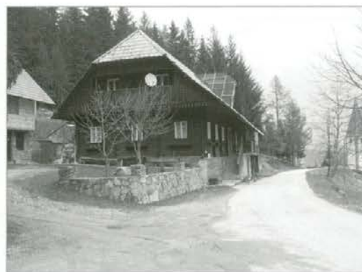
Stara šola na Pernicah