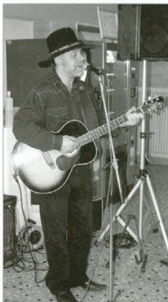
Prireditev je popestril s svojimi pesmimi.

V kamninah, mineralih in fosilih je prepoznal skrivnostni preplet majhnega in velikega, mikrokozmosa in vesolja, vidnega in nevidnega. Ko je ta preplet skušal prenesti na platno, ga je