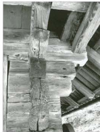
Primer vezanja sten