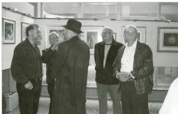
Pidži med prijatelji