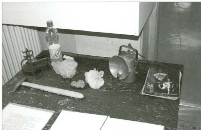
Del nekdanje in sedanje rudarske opreme

Povabljenim in gostom je zaigral na kitaro in zapel, kot zna le on.