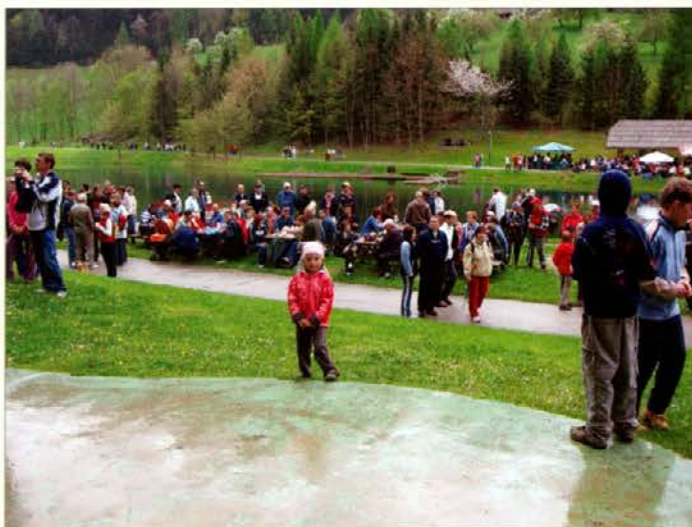
Na prvomajski proslavi na Ivarčkem jezeru