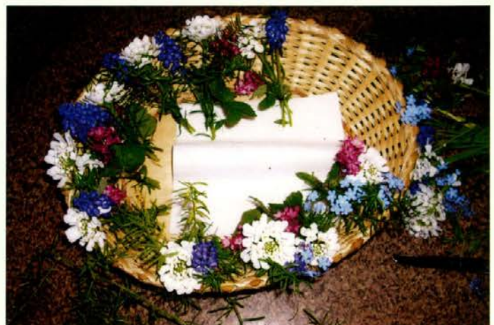
Šopki, ki so jih pripravila dekleta