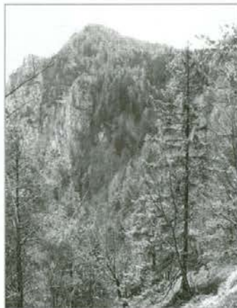
Šumahov vrh (fotografirano pod Marholčami 16.4.2008)