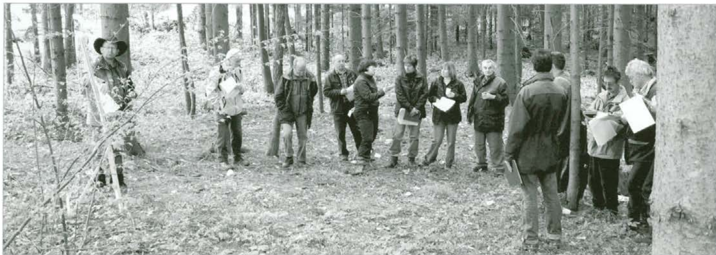
Udeleženci ZGS OE Slovenj Gradec pri uvajanju obnove gozdnogospodarskega načrta GGE Ravne na Navrškem vrhu (24.4.2008)

ta v tem obdobju že odcvetela. V nižinskih predelih je do nadmorske višine 500 m ozelenel tudi macesen, višje pa v drugi polovici aprila. Na Polovcu so na nadmorski višini 900 m (KE Črna) po 20. aprilu ozelenele posamezne bukve.