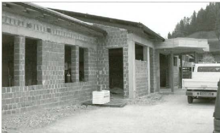
Novi trgovski center v Vuzenici že dobiva prve obrise.

Tako ugodni poslovni rezultati so seveda omogočali tudi večjo investicijsko dejavnost zadruga. Zadruga je tako v