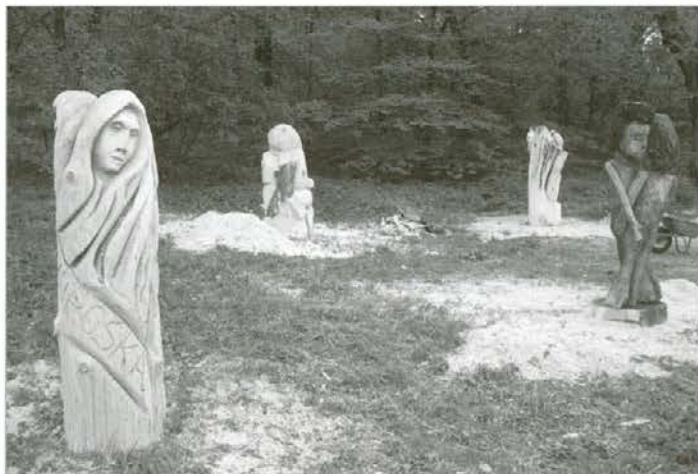
Oplemeniten les na gozdnem robu Navrškega vrha