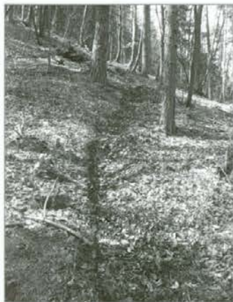
Erozijske sledi brezobzirnih motokrosistov pod Marholčami nad Mežico

Mila zima brez zmrzali, namočena zemlja, za ta čas visoke temperature so vplivale na zgodnje brstenje posameznih grmovnih in drevesnih vrst. V Spodnji Mežiški dolini je čremsa zacvetela že v začetku aprila, medtem ko je v Dravski dolini