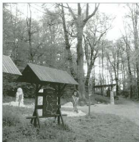
Mednarodni tabor kiparjev na začetku Gozdne učne poti Navrški vrh na Ravnah na Koroškem (28. - 30. 4. 2008)