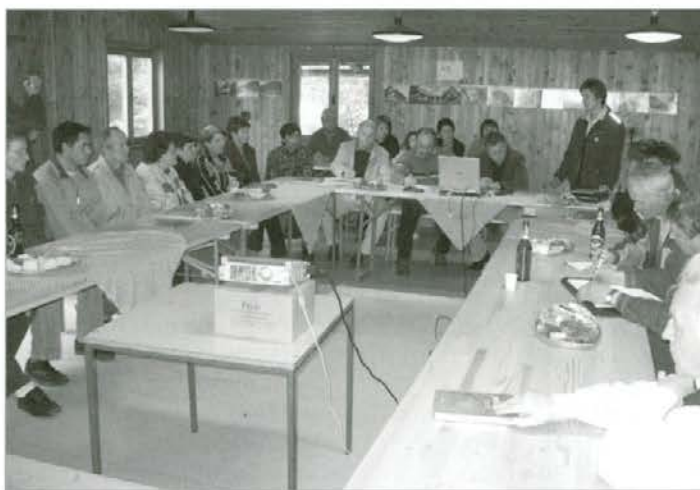
Srečanje v šoli na Pernicah