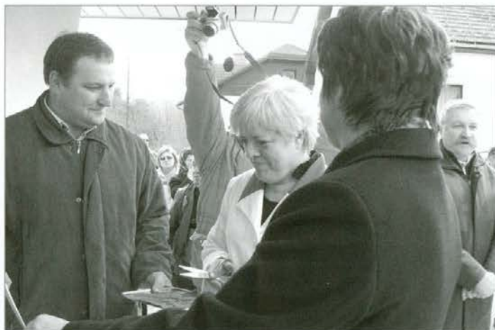
Takšni prizori so zadrugi v ponos – otvoritev prenovljene trgovine v Podgorju.