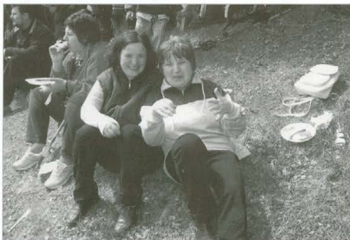
Veselo in živahno je bilo