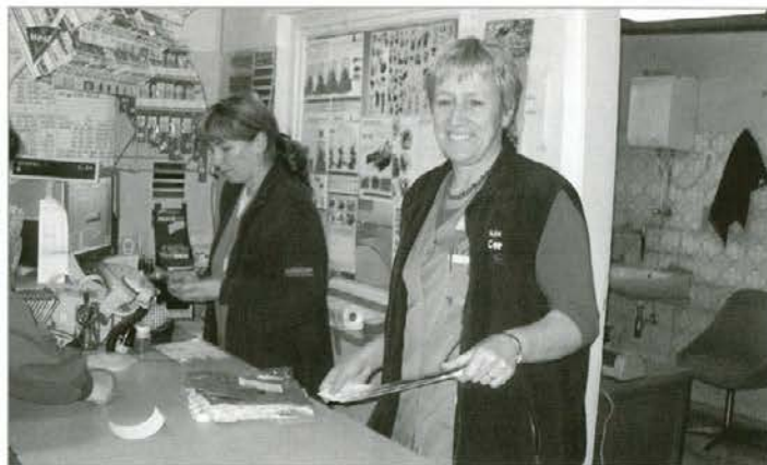
Poslovodkinja trgovine v Vuzenici se že veseli novih prodajnih prostorov.