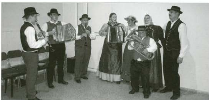
Muzikantje FS Dravograd