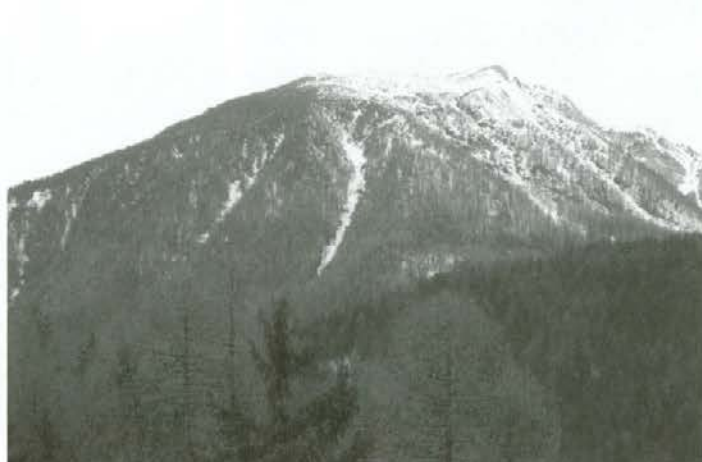
Pogled na Peco z Marholč (16.4.2008)