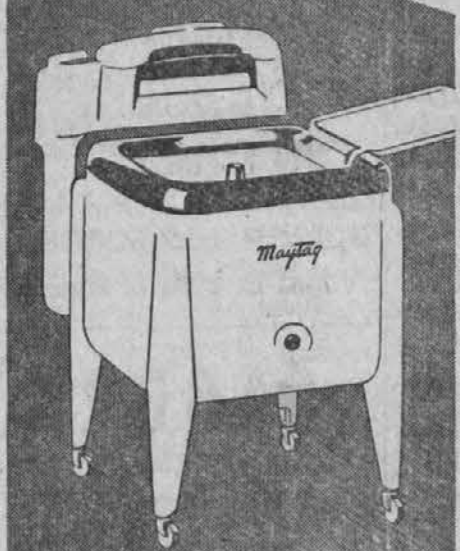
The Maytag Master — Finest Maytag ever built. Large, square, cast aluminum tub has extra capacity. $179 95