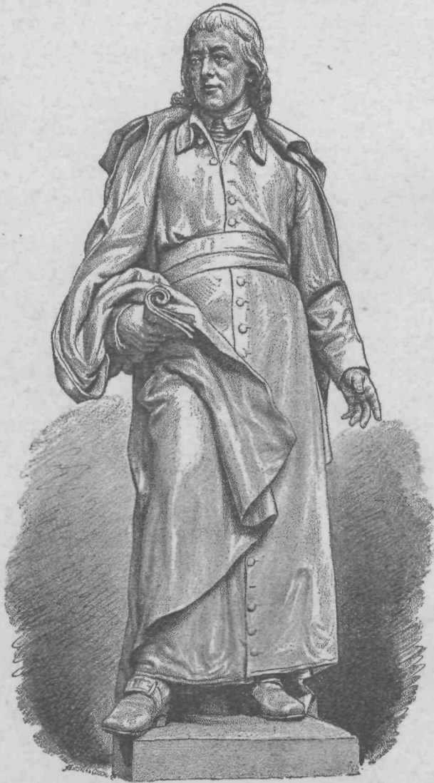
Valentin Vodnik, prvi slovenski pesnik.