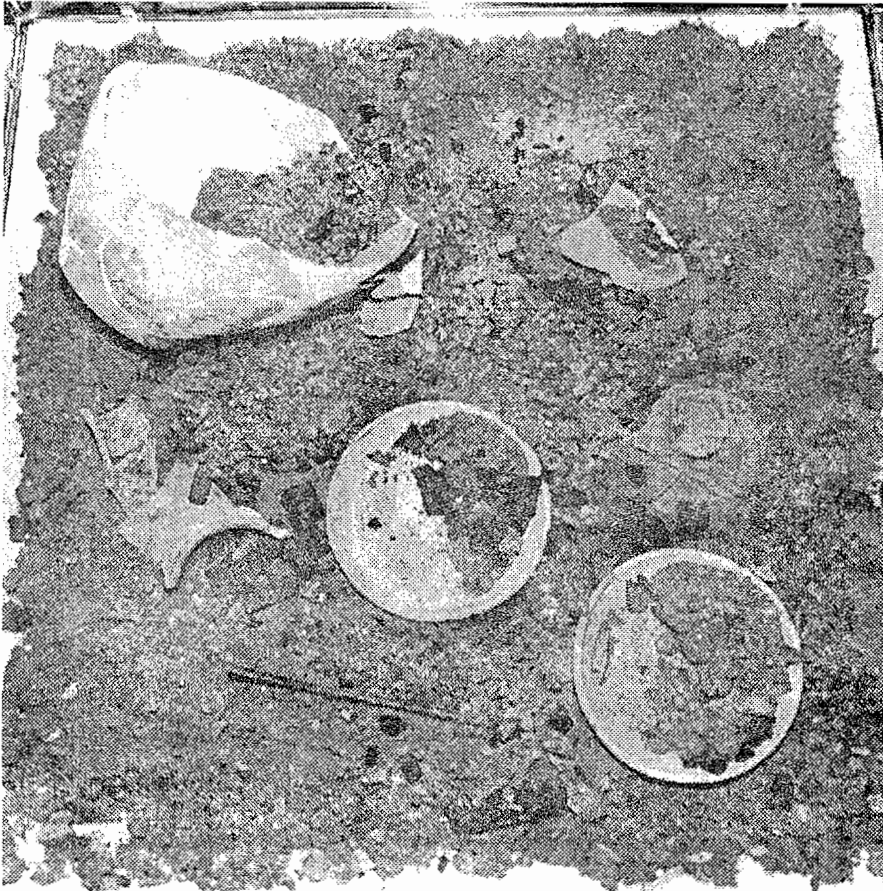
Detaji z razstave „Antični pokop v Pomurju“