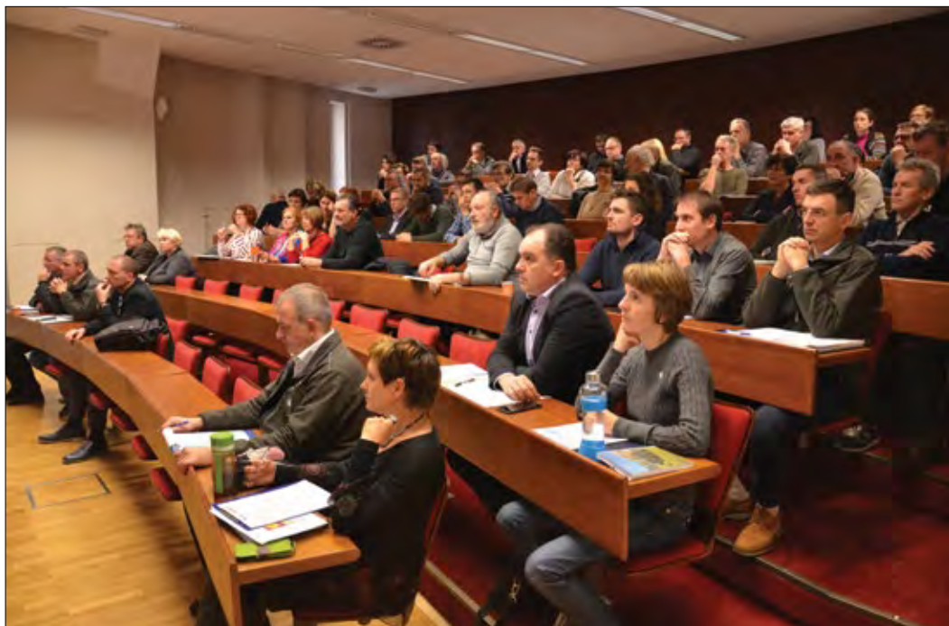
Slika 1: Posvet Eno leto po vetrolomu

Dogodka se je udeležilo 65 predstavnikov gozdarskih podjetji, raziskovalnih institucij, javnih zavodov, interesnih združenj in državnih inštitucij. V prvem delu posveta so predstavniki Ministrstva za kmetijstvo, gozdarstvo in prehrano predstavili svoj pogled na sanacijo ter predstavili delovanje intervencijske skupine, sledile so predstavitve delovanja in ukrepanja Gozdarske inšpekcije, Zavoda