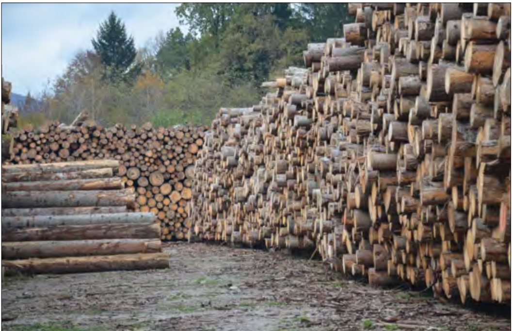
Slika 4: Večja skladišča za les lahko olajšajo in pospešijo trženje gozdnih lesnih sortimentov po večjih ujmah.

Postopke odločanja, ki so določeni s pravnimi okviri, je treba prilagoditi kompleksnim razmeram v gozdovih po naravnih ujmah, tako glede določanja rokov za izvedbo posameznih ukrepov kot glede postopkov oddaje del v gozdovih. Sistem javnega naročanja za oddajo sanacijskih del v državnih gozdovih ne ustreza potrebam delovnega procesa. Administrativne ovire lahko zelo poslabšajo učinkovitost ukrepov sanacije, zato jih je treba odpraviti, tudi s spremembo obstoječe zakonodaje in predpisov. Prilagoditev zakonodaje za učinkovito in hitro izvedbo sanacijskih del je nujna, saj so naravne ujme v gozdovih postale stalnica. Predpisi za izvedbo gozdarskih del v izrednih razmerah bi morali biti (sistemske) poenostavljeni.