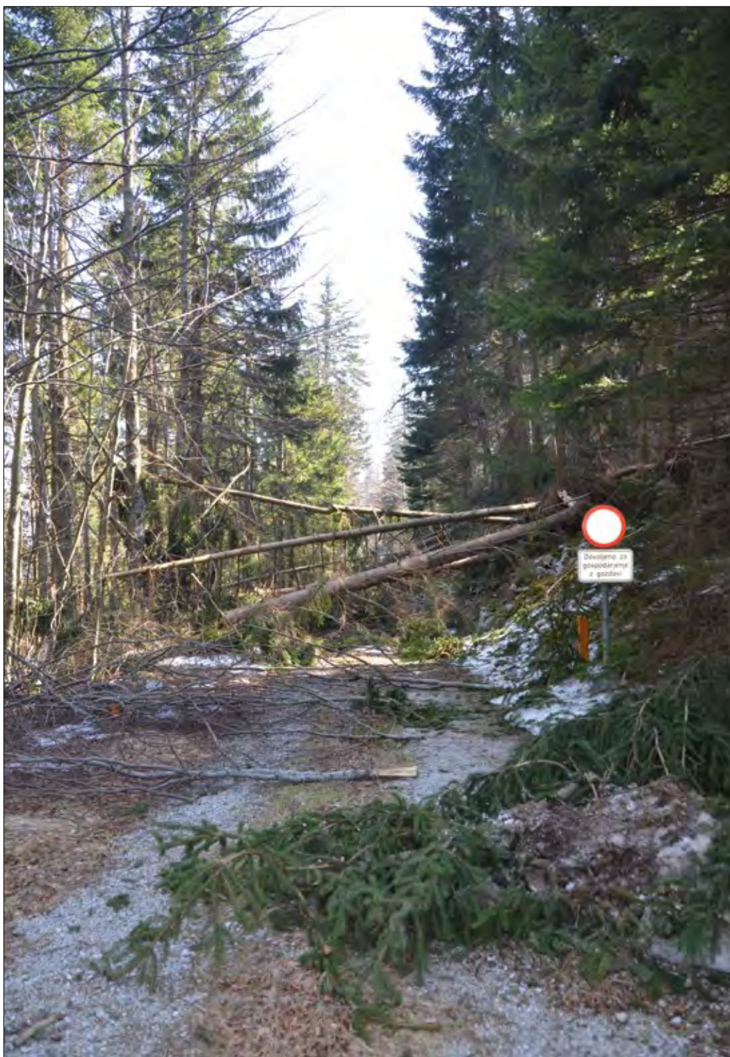
Slika 5: Zagotavljanje prevoznosti cest je ključno za uspešno in hitro sanacijo