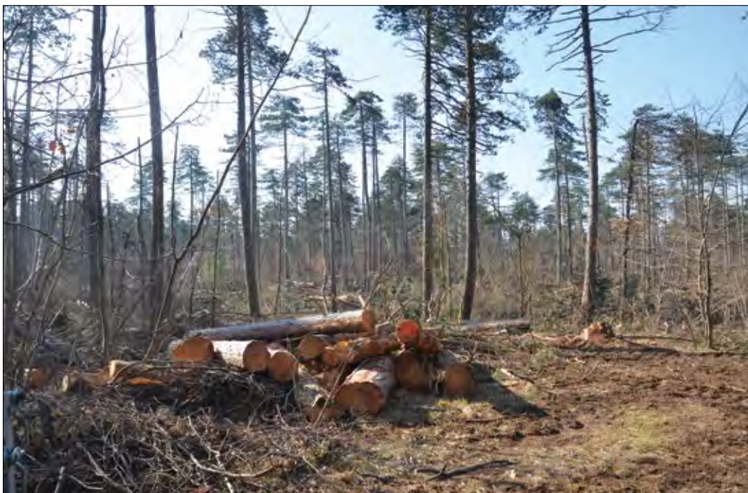
Slika 7: Povezovanje lastnikov gozdov omogoča hitrejšo in učinkovitejšo izvedbo najnujnejših del v gozdovih prizadetih po ujmah