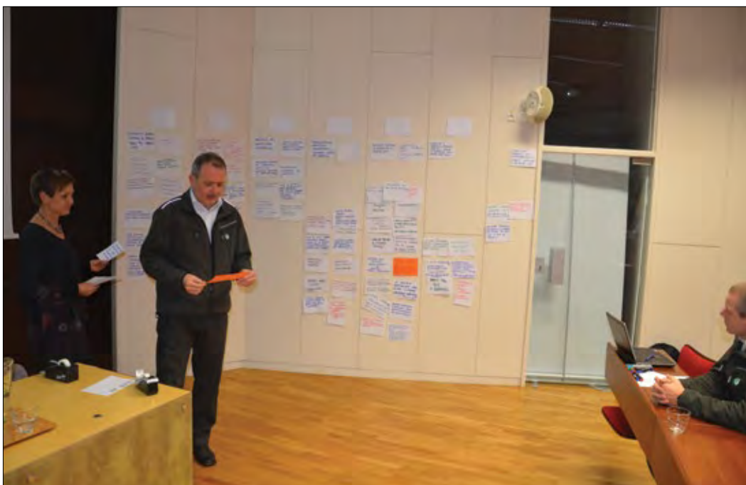
Slika 6: Delavnica, v okviru katere smo zbrali predloge udeležencev za izboljšanje ukrepanja gozdarske stroke ob pojavu naravnih