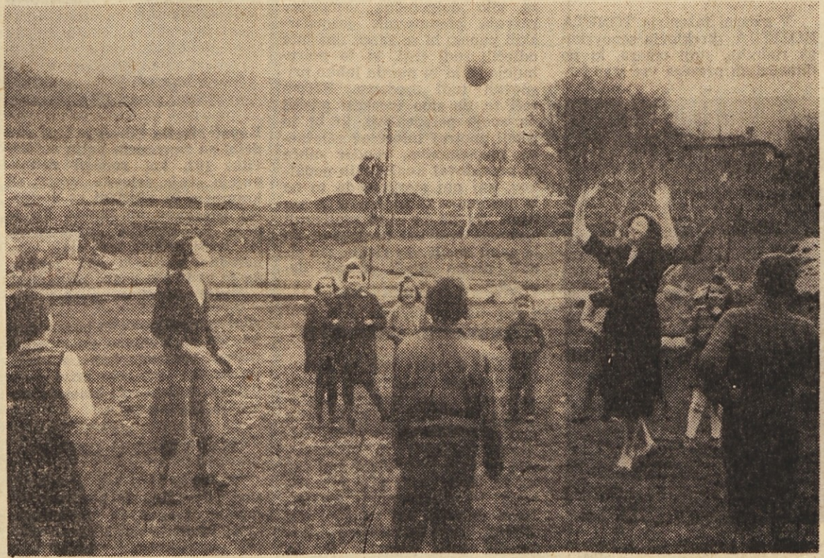
Med šolskim odmorom pod februarjskim soncem

Od tod zahteva celjskih sindikatov: skrb za kulturno vzgojo zaposlenih mora slednjič le postati sestavni del poslovne politike delovne organizacije. — in