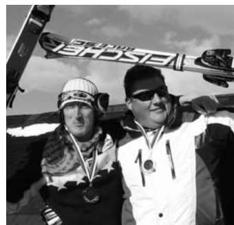
Gosta s svetovnega pokala!