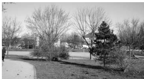
Velika želja učencev in učiteljev je, da bi našo okolico popestrili s klopcami in mizami v senci dreves, saj je letošnja rdečana nit zdravih šol Zdravi pod soncem.

Na šoli so se letos izoblikovale nekatere projektne skupine, v katerih sodelujejo uč-