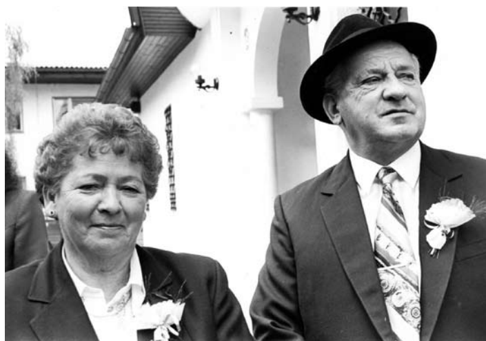
Skupaj z ženo na ob njeni zlati poroki leta 1996