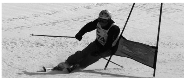
Oh, stil pa je ta pravi.