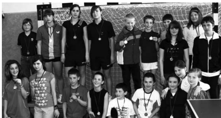
Najboljši, ki so prejeli medalje – vsem čestitamo za njihovo uvrstitev.