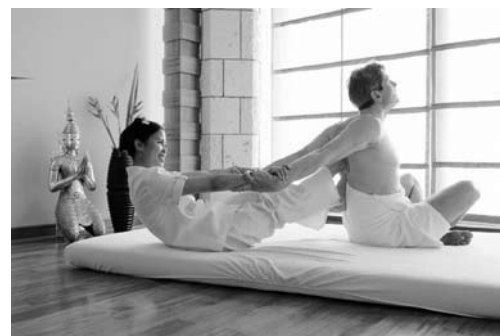
Tradicionalna tajska masaža

pa organizem gradi, hrani in vzpostavlja ravnotežje. To pomeni, da se izboljša cirkulacija krvi in limfe, poveča se toplota kože in izboljša njeno stanje, izboljša prožnost mišic in sklepov; povečata se vitalnost in