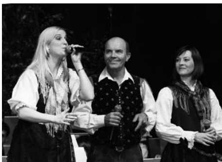
Tercet hišnega ansambla Avsenik