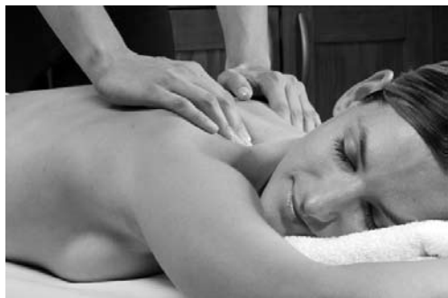
Klasična švedska masaža

Masaže lahko delimo na sprostitvene in terapevtske. Glede na izvor jih delimo na zahodno klasično oziroma švedsko masažo in vzhodne: TUI-NA, ZEN-SHIATSU, tibetanska, ajurvedska, tajska, refleksna masaža stopal in druge. Glavna razlika med klasično in vzhodnimi masažami je v osnovnem pristopu. Pri klasični masaži se pojmuje