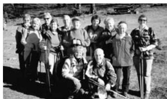
Pohodniki društva upokojencev Mengeš v letu 2008

V povprečju se vsakega pohoda udeleži 8 pohodnikov, vendar pa udeležba niha glede na težavnost in dolžino pohoda. Pohodniki so kondicijsko kar dobro pripravljene, zato večjih problemov na pohodih nimamo. Lahko pa se tudi pohvalimo, da v tem letu nismo imeli nobene poškodbe ali kakšne druge nesreče. Postopno se tudi opremljamo, tako smo lani nabavili čelade, s pomočjo dotacije Občine Mengeš, za kar