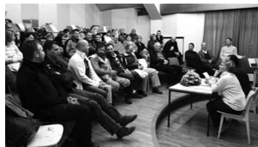
Del članstva kluba, ki je z zanimanjem spremljalo poročila organov društva.