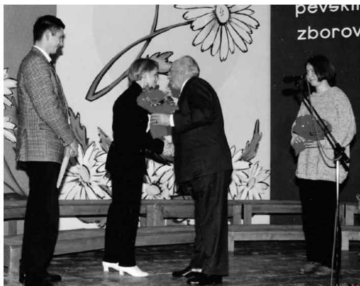
Eden izmed številnih prizorov podeljevanja nagrad