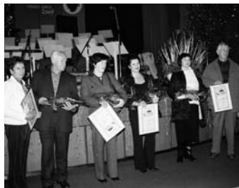
Dobitniki priznanj za urejenost hiš in okolice

POSEBNO POHVALO so prejeli stanovalci Veselovega nabrežja in Staretove ulice v Mengšu – za