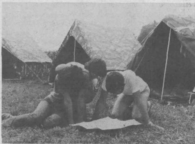
Najprej si je treba dobro ogledati zemljevid, potem pa na izlet!