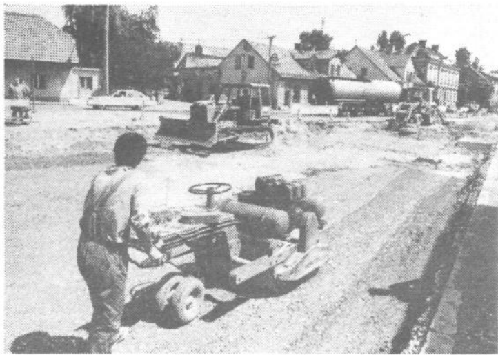
Delavci Cestnega podjetja Ljubljana so z obnovo Tržaške že začeli in tudi obvoz je že urejen. Letošnje poletje bo tako še en del Tržaške bolj podo- ben cesti kot je zdaj. Okrog 300 metrov ceste bo tako imelo enak prečni profil kot lani odprti odsek. Cesta bo štiripasovna, načrtovalci pa so upo- števali tudi dolgoročne razvojne načrte v prometu in rezervirali tudi pas za bodoči tramvaj.

Predsedstvo občinskega odbora ZZB NOV Ljubljana Vič-Rudnik