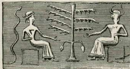
Sveto drevo s sedečima oseba ob straneh; zadaj jedna kača. (Po nekem starobabilonskem cilindru.)

Ima li klinopisno slovstvo kak sled o grehu naših prvih starišev? — me vpraša radovedni čitatelj. Klinopisi sicer ne omenjajo niti z jedno besedo te za vse človeštvo osodne dogodbe, ali glasneje kakor vsi klini nam govori o tem neka babilonska podoba, ki se hrani dandanes v britskem muzeju. Ta podoba nam namreč kaže dve osebi, sedeči ob straneh svetega drevesa in stegajoči svojo roko po sadu drevesnem, med tem ko se vspenja zad za eno teh oseb — kača. Oseba z rogov na glavi pred-