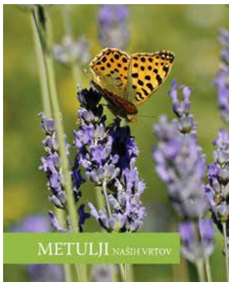
Naslovnica knjižice Metulji naših vrtov .