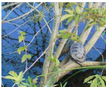
Močvirska sklednica.