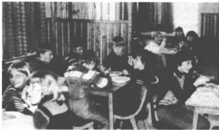
Kosilo jim je izredno teknilo