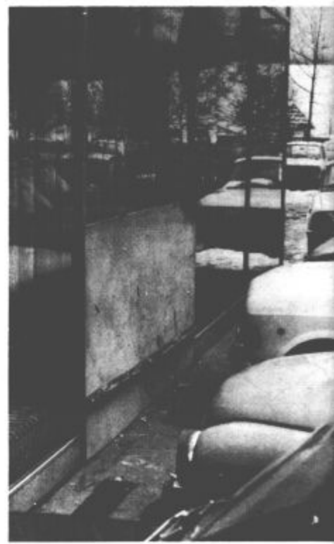
Nespretni vozniki – Mnogim pred stolpi središča Velenja ne uspeva vedno parkirati ga vozila čimbolj blizu steklene stene. Posrednik – vidna – na fotografiji. Verjetno zaradi škodov, ki jih imajo zaradi nenehnih popravil že razmišljajo o varovalnem drogu.