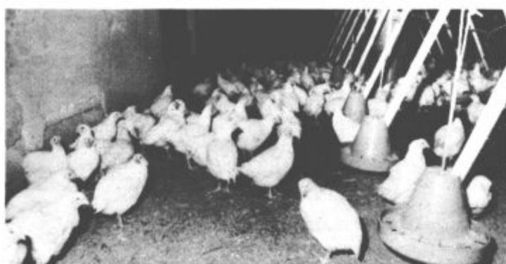
Teža piščancev je zelo odvisna od krme.

Za „NAŠ ČAS“ se po mnenju Sekretariata za informacije izvršne sveta Skupščine SR Slovenije številka 421-1/72 od 8. februarja 1974 ne plačuje temeljnega davka od prometa proizvodov.