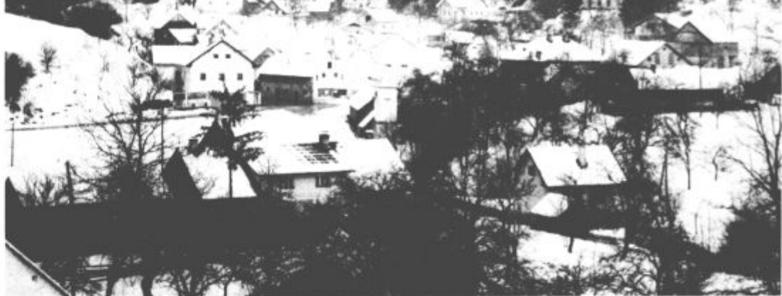
Središče krajevne skupnosti