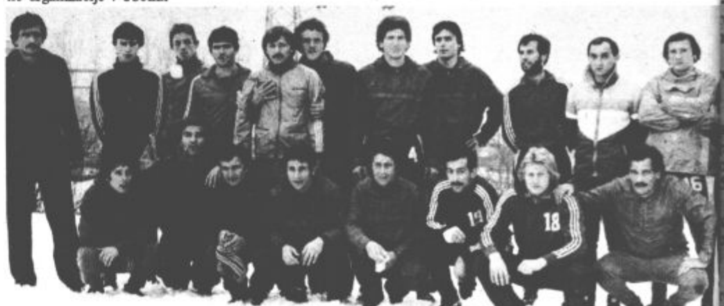
Igralci po ponedeljkovem treningu

Trenutno v prvem mesecu trenira 25 nogometašev, njimi tudi okrepitev (prej Sloga Dobo), Kikič dinstvo Brčko), Vlajič (Beograd), Rauković (O. Miljković (Maribor), Islam (Prozor). Uprava resno računa tudi na svojega bivšega igralca Hohnjeca, vendar še niso ne vse zadeve v zvezi z njegovimi izpiznicami. S prvim moštvom marljivo trenira tudi Rudar.