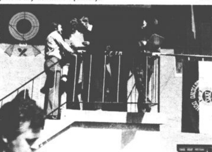
Starešine največkrat prednjačijo zlasti na strelskih tekmovanjih