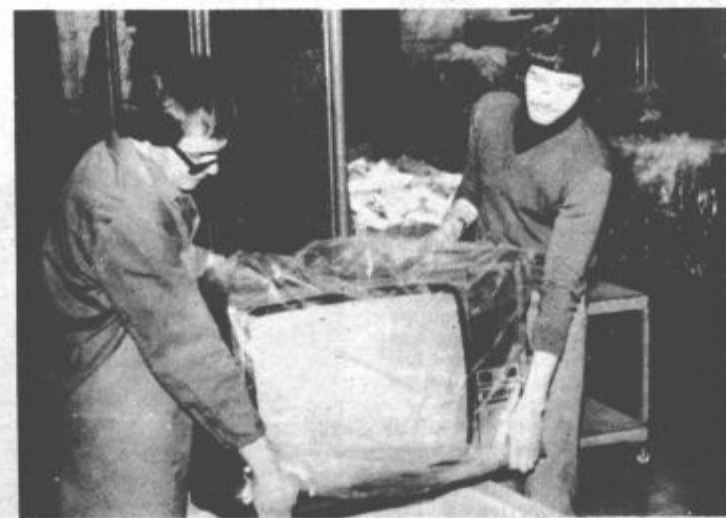
Televizijski sprejemnik bo kmalu v rokah kupca