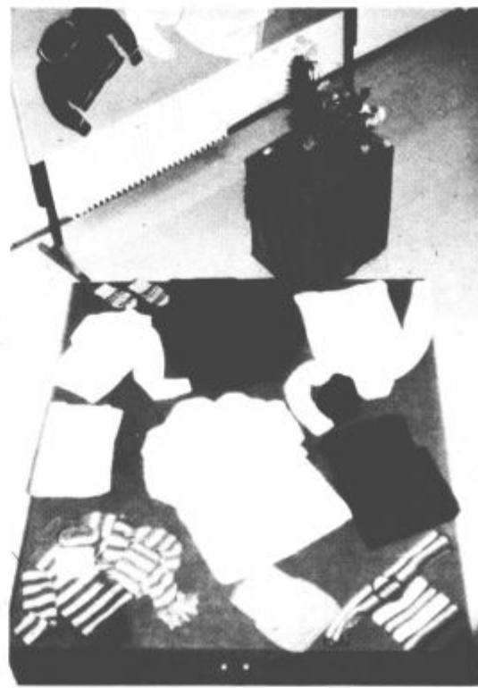
VELIKO ZANIMANJE – V Smartnem ob Paki so ob koncu tečaja pletenja v avli osnovne šole pripravili razstavo vsega, kar so udeležence tečaja med tečajem naredile. Ker je bilo za tečaj veliko zanimanje ga bo društvo prijateljev mladine ponovilo. (J. K.)