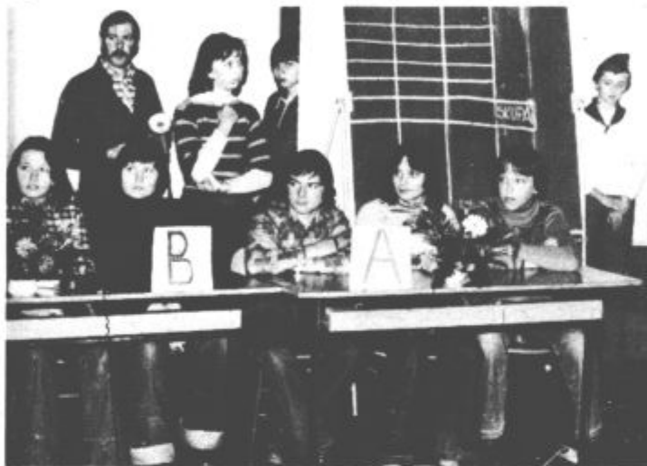
Učenci so pokazali, da zelo dobro poznajo življenjsko pot in delo Otona Župančiča.