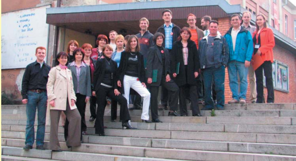
Komorni zbor KID Limbar