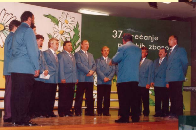
Moški pevski zbor KD Tine Kos