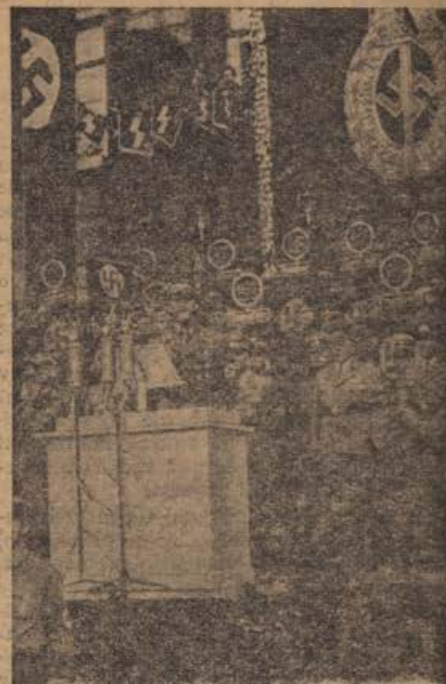
Weltbild SA. Wegener.

Počastili bomo na dan mrtvih vsaj v mislih — v kolikor ne moremo na pokopališča — spomin tistih, ki so se morali ločiti od vsega, kar jim je bilo najljubšega. Usmerimo danes naše duševne poglede par minut med pokojne, kjer bodo danes ali jutri, ko nam bo minila radost in žalost, tudi naši grobovi; tam v tistih tihah jamah, kjer vlada samo mir in šelest večnosti.