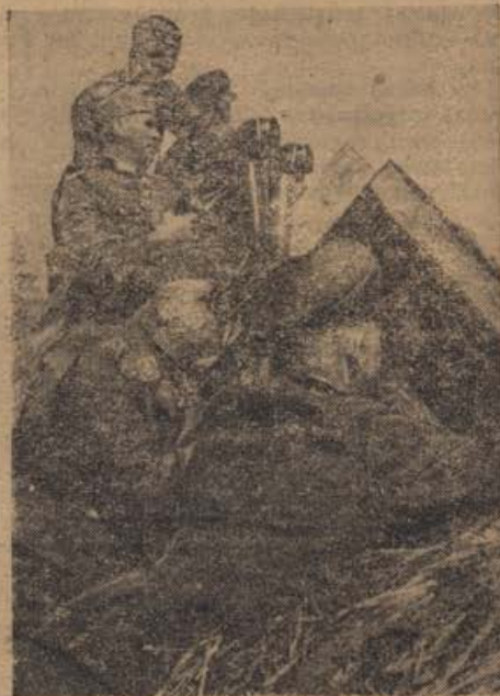
PK-Kriegsbericht Wetzell (Sch).

* Roosevelt-ova vojna politika in ženske. Kakor se je izvedelo iz svetovnega časopisja, je Roosevelt v Londonu izdejtvoval, da je angleška kraljica povabila njegovo ženo na obisk v London, in sicer v zadevi dobrodelnih mladinskih akcij. Mi smo že zadnjič zapisali, da pomaga gospa Roosevelt-ova svojemu možu vladati, ne da bi za to imela kakšno funkcijo. Če je Roosevelt sedaj po ovinkih izdejtvoval, da njegova žena obišče angleški kraljevski par, ima to potovanje gotov namen, da mu dolgozoba in ostrojezična žena uredi kakšno diplomatsko zadevo, ki jo upa na ta način najboljšje urediti. Roosevelta imata pa tudi nečakinjo, ki je poklicna ali amaterska plesalka. Naj si bo prvo ali drugo. Thea ali po naše Treza, nastopa skoraj popolnoma gola, kakor pač nastopajo ameriške