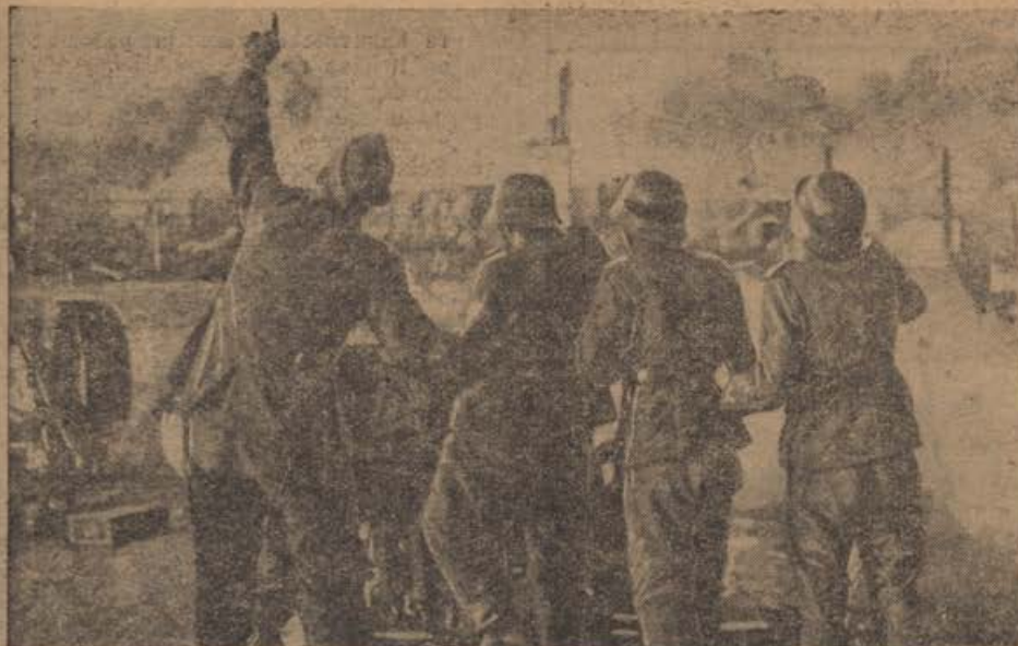
PK-Kriegsbericht Opitz (PBZ-Sch).

Leichte Flakartillerie wehrt sowjetischen Tiefangriff in Stalingrad ab.