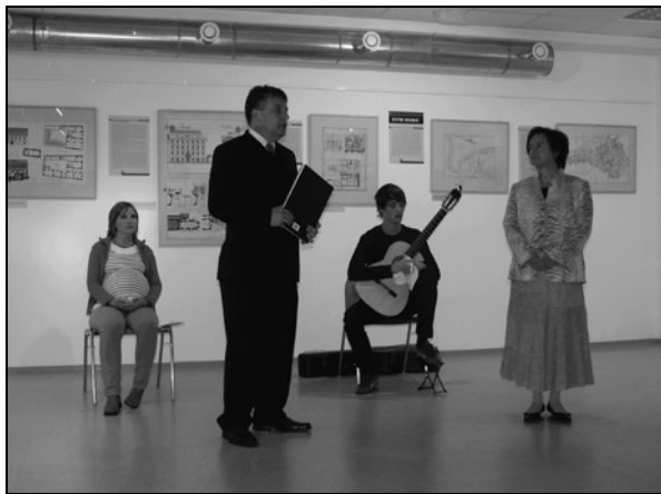
Otvoritev razstave v Celju, 2. 10. 2008