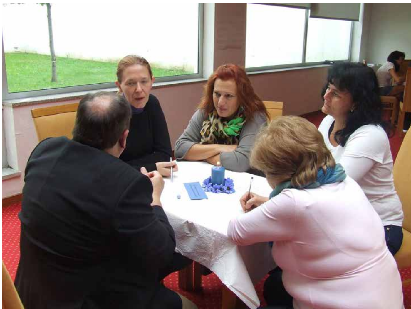
Slika 2: Učenje v medkulturnih skupinah na seminarju Intercultural Project Management