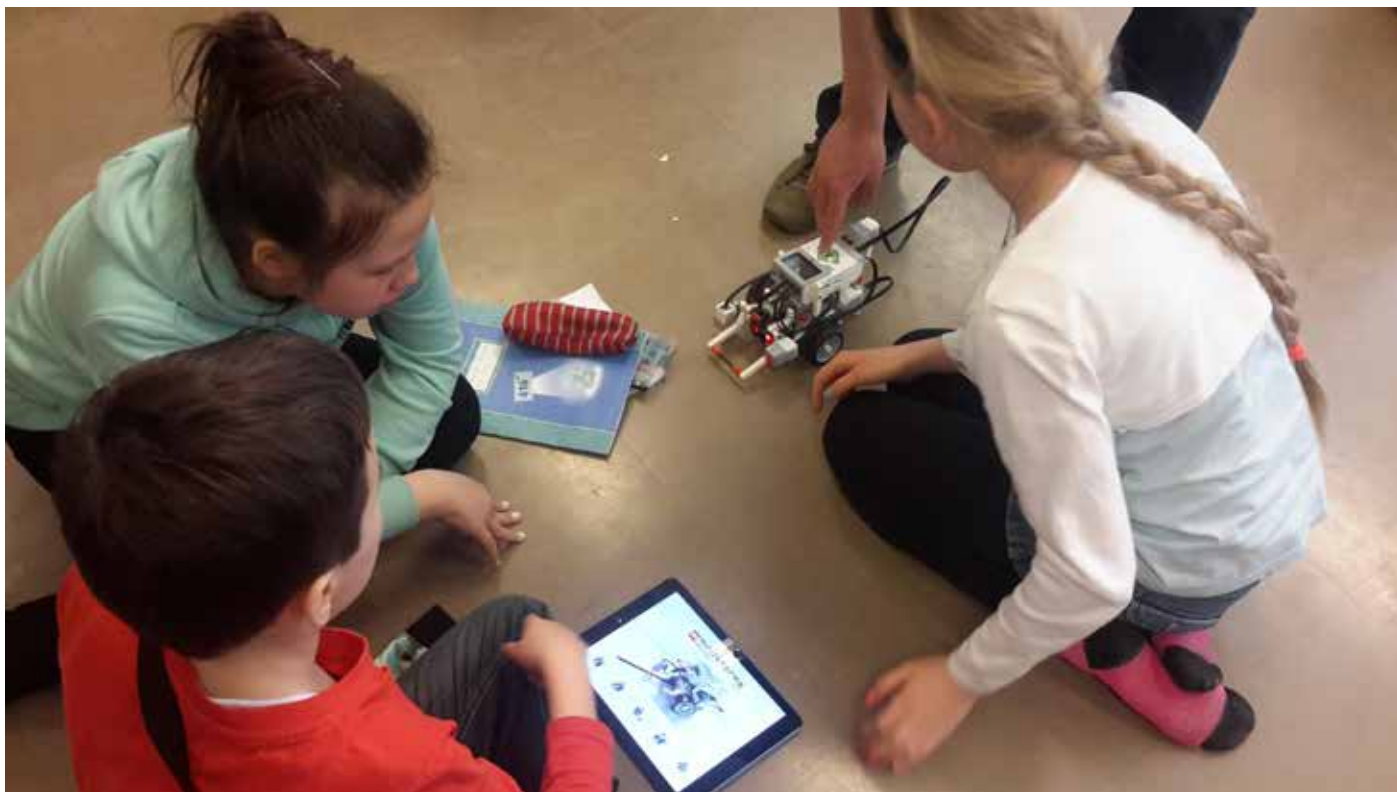
Slika 3: Uporaba tablic za ustvarjalnost in učenje novih tehnologij med poukom na Mednarodni šoli Tampere, Finska

in delu z drugimi partnerji. Vzpostavili smo mrežo osnovnih in srednjih šol v Sloveniji, ki se želijo izobraziti na področju MF in jih implementirati v vsakdanje delo. Obenem smo našli mednarodne partnerje, s katerimi bomo oblikovali Erasmus+ K2.