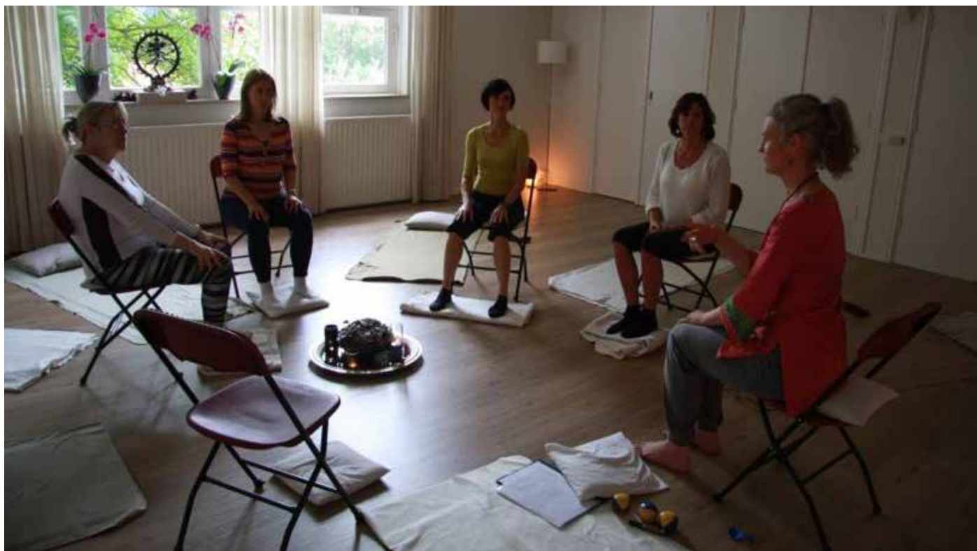
Slika 4: Izkustveno učenje na seminarju mindfulnessa na Nizozemskem