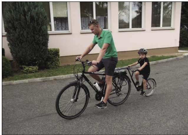
Najmlajši udeleženec (4 leta) je maraton prekolesaril s pomočjo očeta

15. septembra okrog pol desete ure so se pri hotelu Lipa v Monoštru v lepem številu zbirali udeleženci VIII. kolesarskega maratona Lipa. Skupino kakih štiridesetih kolesarjev je pozdravilo lepo, za kolesarjenje prav primerno vreme. Po registraciji sta