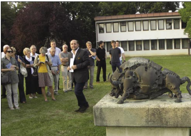
Janez Boljka, Bik , skulptura v bronu iz leta 1985, ki spada v sam vrh sodobnega kiparstva na Slovenskem.

Pomurski muzej je izdal tudi brošuro dr. Janeza Balažica o Murinem parku skulptur. Direktorica muzeja Metka Fujs je v Predgovoru zapisala: »S pomočjo gospodarstva so se od šestdesetih do devetdesetih let 20. stoletja oblikovale mnoge umetniške zbirke, ki so našle mesto znotraj podjetij kot del opreme poslovnih prostorov, tovarniških dvorišč ali celo zunaj le-teh v obliki javnih plastik, ki so še danes zaščitni znak mnogih slovenskih krajev... V pogojih svobodnega tržnega gospodarstva, ki ga uravnavajo globalni trendi, pa se je v novem tisočletju drastično spremenila tudi podoba in vloga indu-