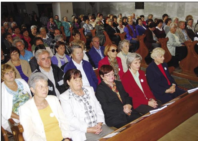
Števanovska cerkev že dolgo nej tak puna bila kak na Srečanju Porabskih Slovincov