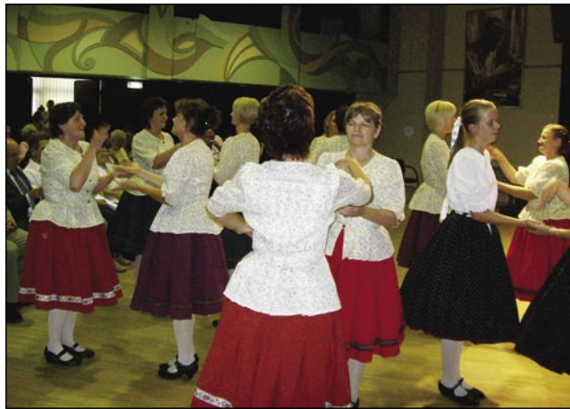
Ženske iz Slovenske vesi so plesale slovenske in vogrške plesse

Samouprava je tō pozvala nastopajoče in naše goste v narodni dom, gde smo nadaljevali pri bejlom stauli. V narodni daum pela paut prejk parka narodnosti, gde stoji spomenik, steroga so postavile narodnostne samouprave. Pred njim smo napravili