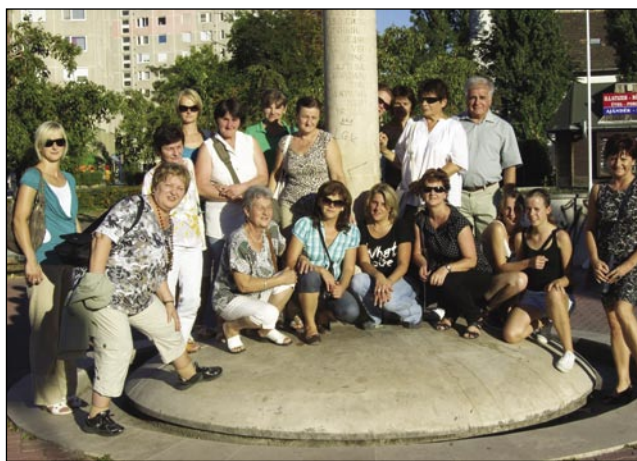
Spominska slika v parki

že po porabski vasaj, zvūn toga v Csörötneki, v Magyarlaki, na Rábafüzesi in v Magyarnádalji. Program se je začno v šestnajstoj vōri. Naši gostje so že rano mogli gorastaniti, aj se pri cajta pripelajo k nam. Najprvin smo je pogostili v enoj gostilni. Potistim so se preoblekle ženske v lepe noše. Ravnateljica