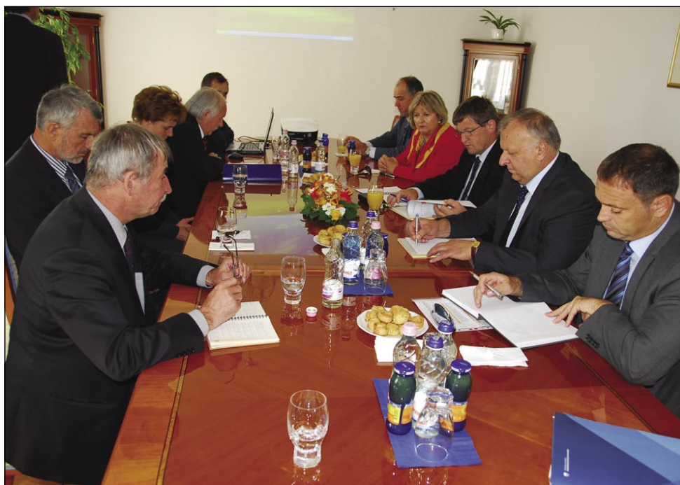
Na pogovorih na Generalnem konzulatu RS v Monoštru

Med tem so se na Generalnem konzulatu RS v Monoštru pričeli pogovori slovenske delegacije s predstavniki Porabskih Slovencev. Na kasnejši tiskovni konferenci je minister Bogovič povedal, da se je letos na Ptuj podpisal protokol, s katerim se je združenje AGROSLOMAK tudi formaliziralo, kar je pomemben korak pri povezovanju zamejskih pokrajin na področju kmetijstva.