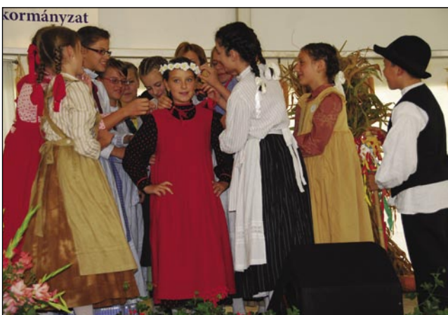
Mlašeča folklorna skupina iz Števaovec je zaplesala gostüvanjske ples