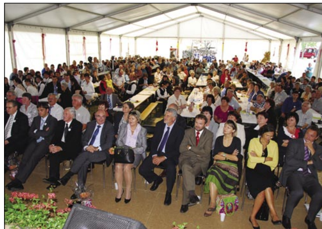
V velkom šatori so se zbrali lidgé iz porabski vasi, Budimpešte, Mosonmagyróvára, Sombotela pa iz Prekmurja tö