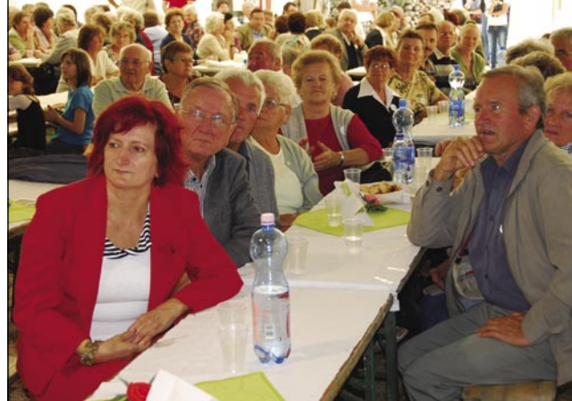
Znanci, padaši, žlata... pri istom stauli