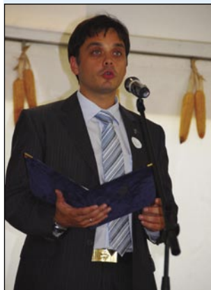
...in državni podsekretar Ministrstva za človeške vire Csaba Latorcai