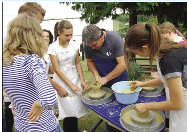
Zadvečerek so bile delavnice, med njimi lončarska