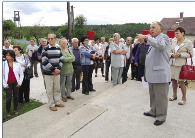
Sto je želo, si je leko pogledno graničarski muzej