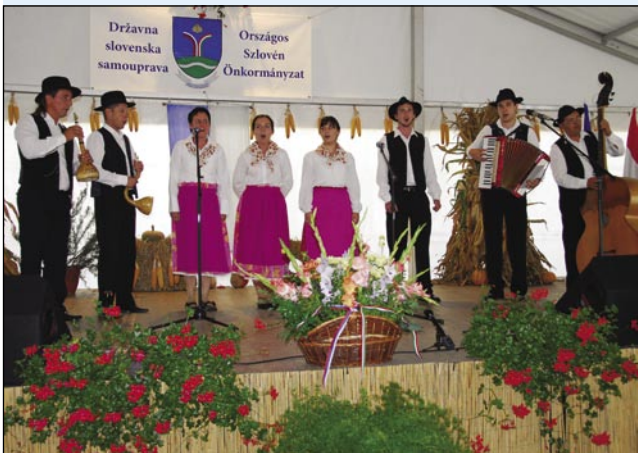
Zgrablenci na kvadrat iz Büdinec so zaspejvali goričke pa prekmurske pesmi