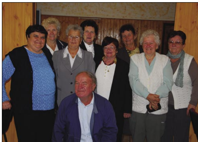
Na Gorenjom Seniki so se najšli tisti, steri so od lejta 1949 do leta 1957 ojdli v šaulo

se na Gorenji Senik, zato ka so stara mati, tetica pa botra tü živele. Dapa zdaj že zaman pridem, ka nikoga nejman več, vsi so tapomrli. Za volo tauga me je mojo srce tak bolelo pa tak žmetno