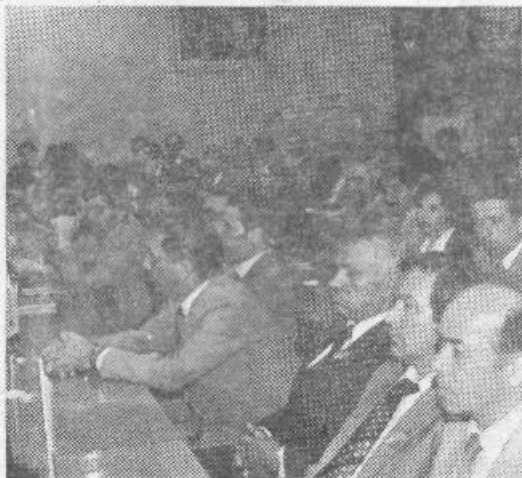
Slavnostna seja delavskega sveta

Zakaj pisati o ljudeh, času in okoliščinah, v katerih je nastal »TIKI«?