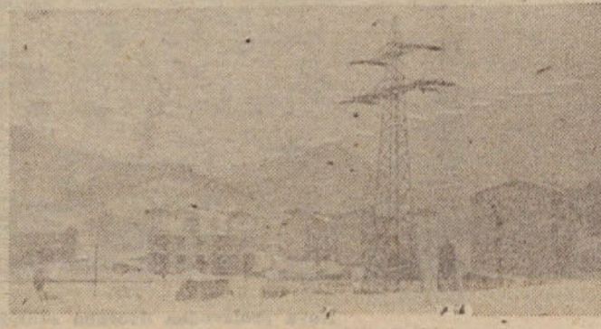
Novi bloki v Medvodah

V planu je predvidena tudi zgraditev industrijskih objektov v Šiški ter skladišč in proizvodnih prostorov v Sentvidu.