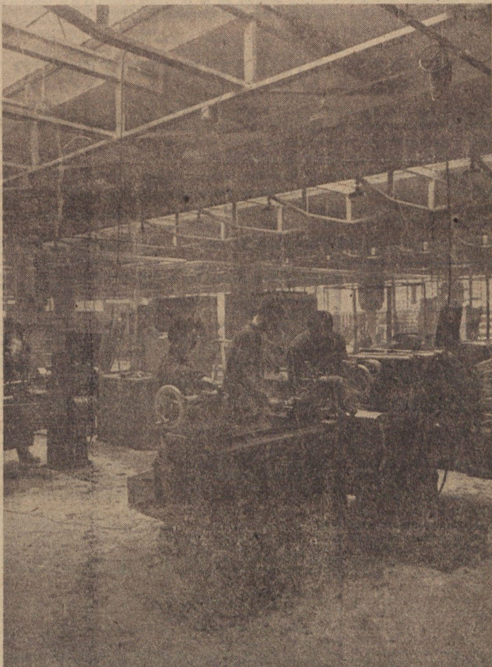
Nova proizvodna dvorana »TIKI«

Gospodarski uspehi v letu 1962, predvsem pa nadvse (Nadaljevanje na 2. strani)