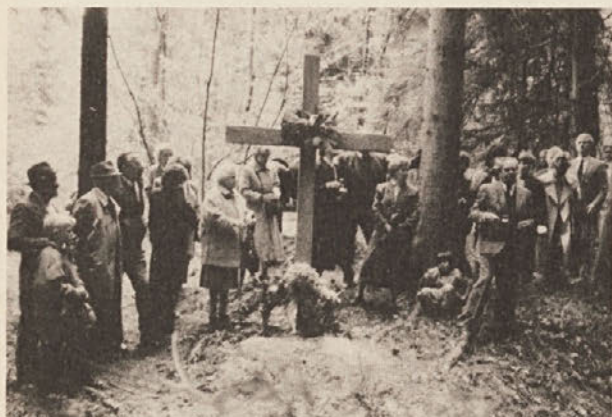
Sv. maša je bila v cerkvi v Lešah. Na kraju, kjer je bilo pobitih in zakopanih približno 200 odvedencev, stoji danes križ.