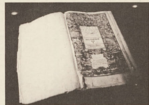
V Št. Pavlu je na ogled Dalmatinova Biblija, ena zelo redkih na Koroškem.

Prva koroška deželna razstava v Št. Pavlu v Labotski dolini ne zamoči tudi slovenskega lica Koroške. Tako je razstavljena tudi Dalmatinova Biblija iz leta 1584. Ta je namreč glavno delo reformacijske literature ter hkrati temelj slovenskega