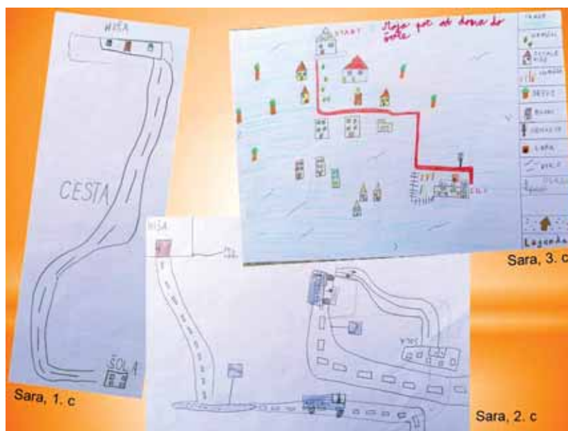
Slika 5: Razvoj prostorske orientacije pri učenki Sari