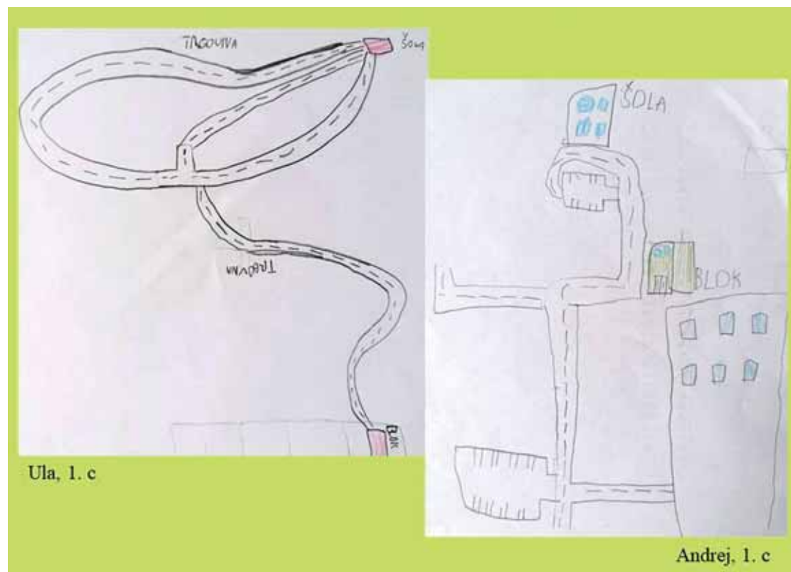
Slika 1: Pot od doma do šole v prvem razredu (šolsko leto 2016/2017)

Začetki projekta segajo v šolsko leto 2016/2017, ko je 25 učencev 1. c oddelka ob koncu šolskega leta na papir narisalo pot od doma do šole. Zemljevidi so si precej podobni – na njih vidimo cesto, ki povezuje dve zgradbi (dom in šolo). Le sedem učencev je narisalo dodaten objekt, npr. stopnišče ob šoli, semaforiziran prehod za pešce, pekarno, bar, trgovino, semafor, parkirišče