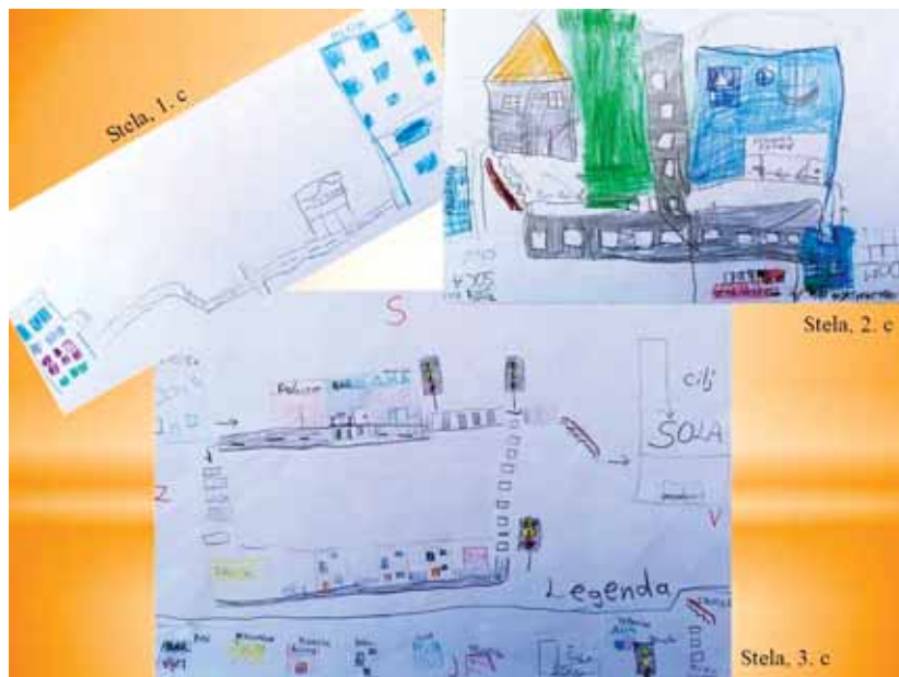
Slika 4: Stelino zaznavanje okolice na poti v šolo