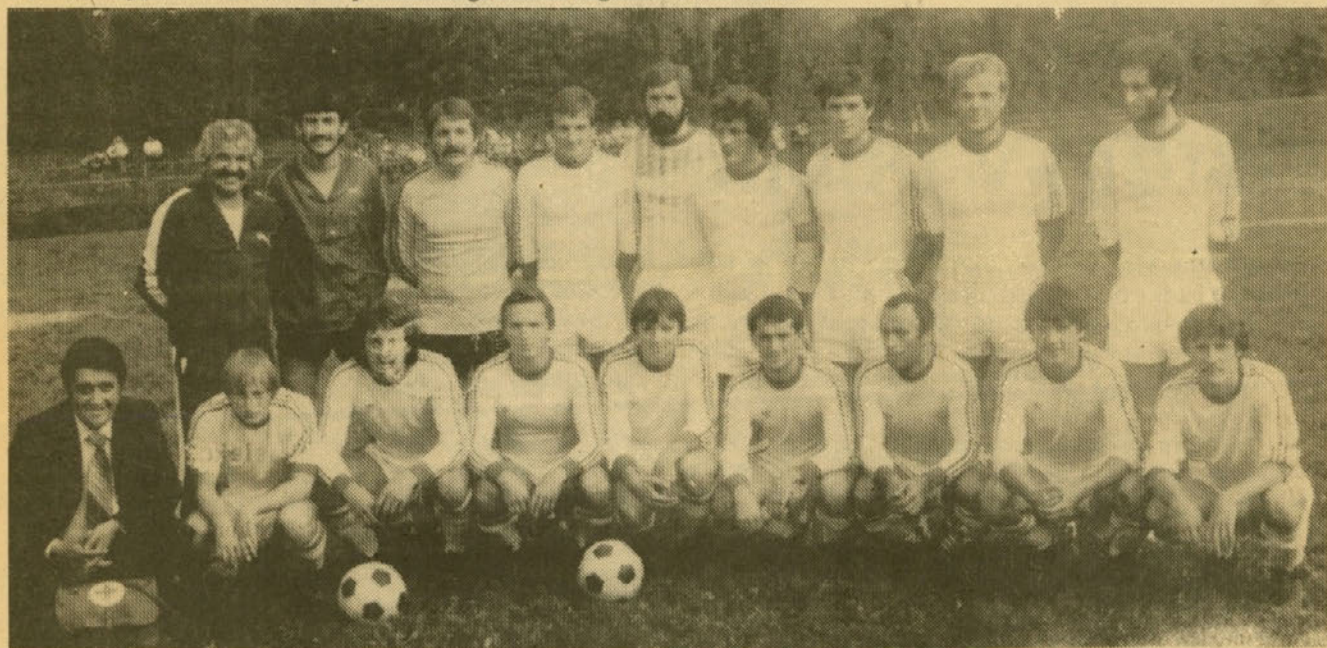
Peta selekcija, NK Steklar, nosilka piramidalnega sistema nogometa v naši občini