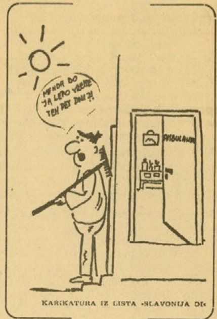
KARIKATURA IZ LISTA »SLAVONIJA DE«

Pri nas razmišljamo tudi o rekreaciji. Zato je za slehernega delavca iskanje kadrovskega oddelka na »dilah« čudovita priložnost, da preizkusi svojo kondicijo na stopnišču naše upravne