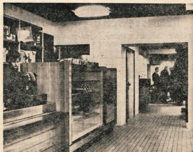
V Cankarjevi ulici v Kranju so minuli četrtek odprli preurejeno slaščičarno — kavarno.