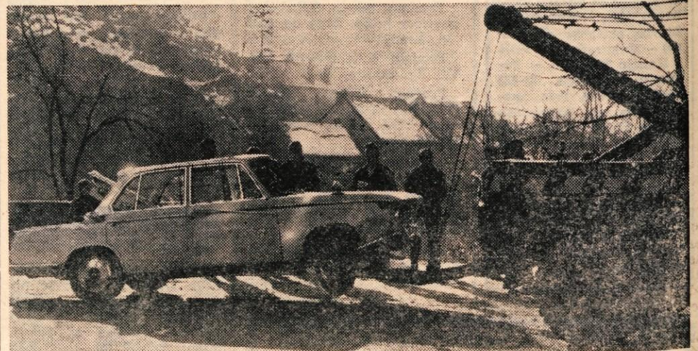
Slabo vreme s poledico na cestah bi moralo voznike opozarjati na previdno vožnjo. Nesreč zaradi prehitre vožnje na spolzkih cestah je bilo v zadnjih dneh kar precej. Avtomobil na sliki je zaradi prehitre vožnje na poledeneli cesti trčil v mostno ograjo v Mostah pri Zirovnici in se nato še prevrnil v strugo Završnice.