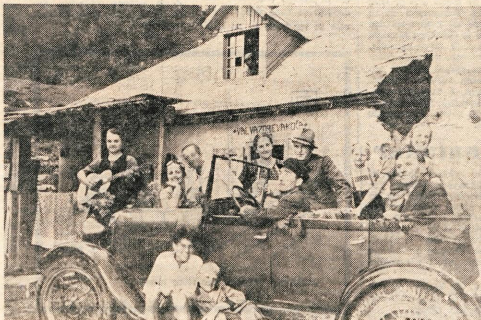
Prvi avtomobil, ki je pripeljal do kočice.