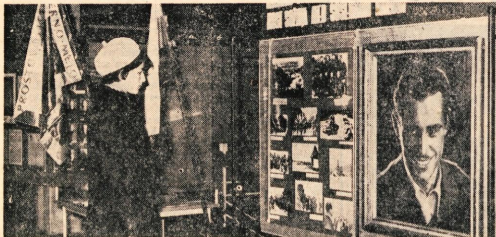
Ob 50. obletnici bojev za severno mejo je občinska organizacija zveze združenj borcev NOV Jesenice v prostorih trgovskega podjetja Zarja pripravila razstavo dokumentarnega gradiva

Najbrž ni treba posebej razlagati, kaj bi pomenilo sprejetje takšnega odloka v vseh gorenjskih občinah. Poudariti želimo le, da je pobuda za sprejetje takšnega odloka oziroma odločitve najbrž vredna vse pohvale. A. Z.