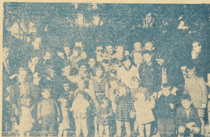
Z begunci je prišlo tudi mnogo otrok.

Más todavía: En 1929 se publicó la ley antireligiosa que prohíbe a la juventud menor de 18 años asistir a los actos de culto. Las organizaciones religiosas tienen prohibido reunir la juventud en los actos de devoción y realizar reuniones para juventud y mujeres. A los sacerdotes se les prohíbe ejercer cualquiera función fuera del lugar del culto, de modo que toda enseñanza religiosa de la juventud queda excluida, ya que también a los padres mismos se les prohíbe la formación reli-