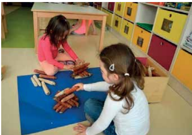
► Gradimo stolp iz koruznih storžev