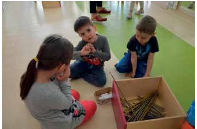
► Matematika tako ali drugače