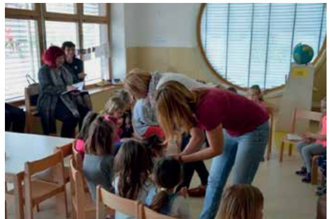
► Igra rinčico talam

Uvodni del se je začel z igrico rinčico talam . Otroci so jo že poznali. Pri njej so vsi sodelovali, vsi bili aktivni, pozorni, drug drugega so poslušali in ugotavljali, kaj je imel v rokah. S to igro sva jih s sodelavko razdelili po skupinah (delitev s pomočjo fižola, kamenčka, koruze in frnikole; s temi materiali so tudi delali v določeni skupini).