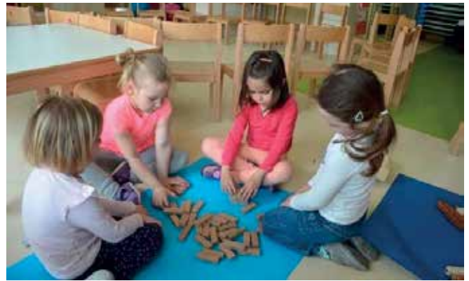
► Gradimo stolp s pomočjo jenge