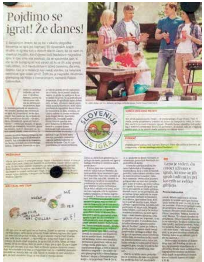
► Članek v časopisu Nedelo

S pristopom glas učenca nam iz zidakov uspeva graditi trden most do učenja, saj po dobrih dveh letih vključevanja načel projekta BRIDGE z radostjo ugotavljam, da so otroci veliko bolj samozavestni in samostojni. Vsakdanje izzive, tudi prepire s sovrstniki, skušajo najprej sami reševati in se ne zatekajo takoj po pomoč k vzgojiteljici. Ponosni so, da zmorejo sami, da njihov glas šteje, radi se pohvalijo s tem. Postavljajo veliko več kakovostnih vprašanj, bolj suvereno pripovedujejo pravljice, ki si jih lahko izberejo sami. Iz vsega tega in pozitivne povratne informacije staršev črпам moč pri delu in odločenosti, da bom glas otroka krepila še