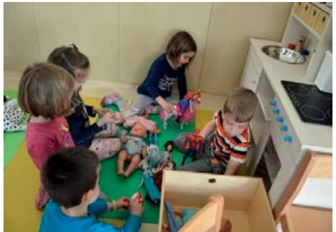
► Igramo se z izbrano igračo

Otroci si želijo nekaj novega, željni so izzivov. Tako tudi začetijo pripadnost skupini in dobijo občutek uspešnosti.