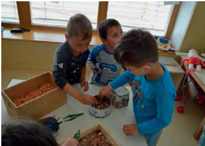
► Prebiranje fižola