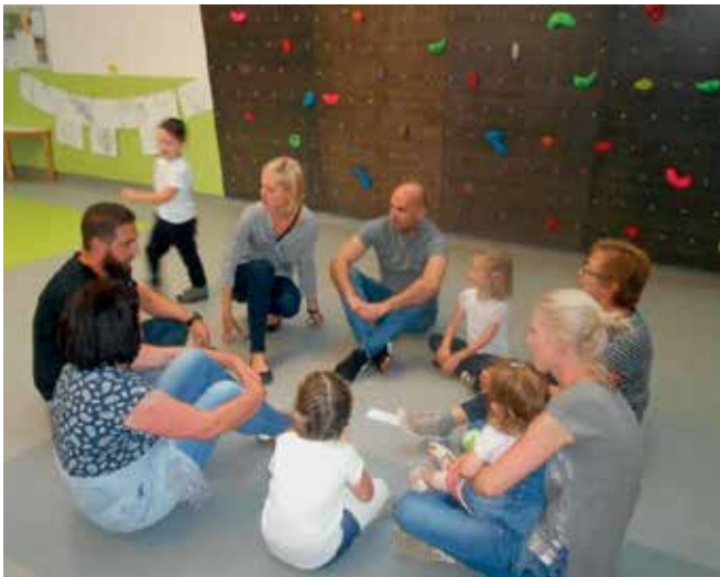
► Medgeneracijsko druženje ob igranju starih iger