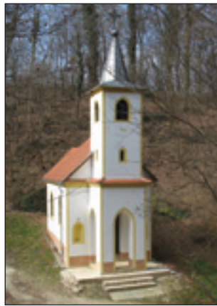
V Szentkút so na prauško ojdli vnaugi iz Porabja

Za dobri 15 kilomejterov se že pride iz Hévíza do Blatnoga jezera. Na jugu Balatona pela šurka pa nagla avtocesta, depa če škémo kaj videti, je baugše, če se pelamo po staroj poštiji. Vesnice so, kak liki bi bile zo-