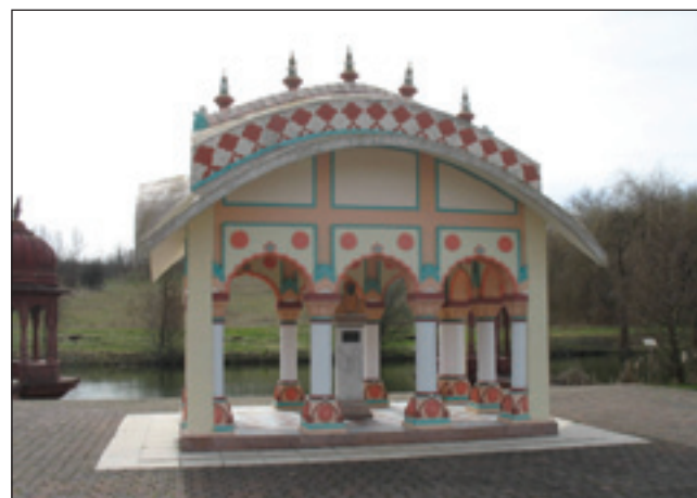
»Kapejla« Prabhupáde, šteri je pripelo krišnovsko vöro

Za pau vöre pelanja smo že v Somogyvámosi , gde se godijo nej vsakdanešnje dele. Nej daleč od té vogrske vesnice, na 266 hektaraj leži takzvana »Krišnovska dolina«, gde kauli 150 lidi živé v najvejšom pada-