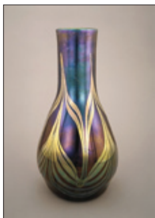
Originalna vaza L.C. Tiffanyja

svinčevimi trakovi, »šivi« in jih vlagali v kamnite okenske okvire. Tehnika se do danes, v bistvu ni spremenila. Rezi- la in izbor najrazličnejšega stekla je sicer močno izpopolnjen, kar pa samo po sebi še ne zagotavlja višje kvalitete. Vsekakor pa veliko barvnih sestavin in efektov ostaja še danes skrivnost mnogih manufakturnih delavnic.