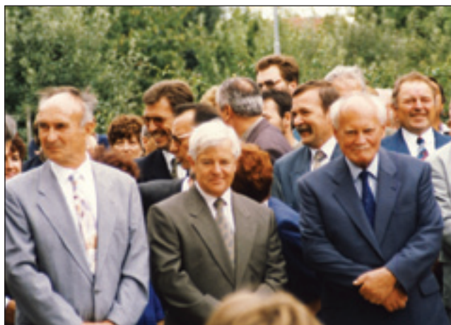
24. avgust 1997 je biu za Kobiljčane velki den; Pavel Nemet z Milanom Kučanom in Árpádom Gönczem

24. avgust 1997 je biu za Kobiljčane velki den. Na otvoritev mejnoga preho-