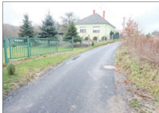
Hiša v Slovenski vesi

»Osemdesetdevetoga leta, vekša hči je te začnila delati, menkše so pa eške v šaulo ojdle. Nej je leko bilau, kak pravijo, sto se je za srmaka