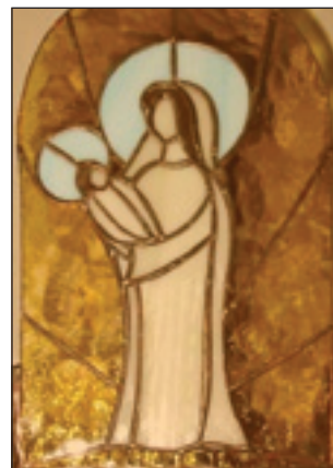
Okrasna steklena plošča, Marija z Jezusom

uporabljal. A ker se seveda okusi skozi časovna obdobja spreminjajo, je v današnjem času ravno Tiffany s svojo dediščino spet zelo priljubljen. Pri nas v Sloveniji imamo enega izmed priznanih strokovnjakov na področju vitra-