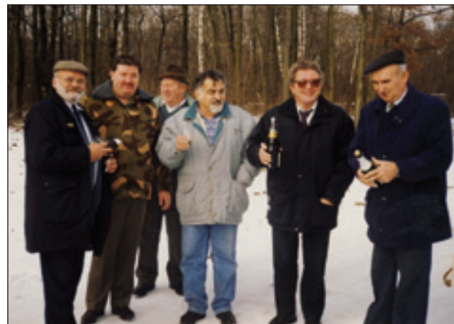
Na granici z vogrskimi župani

pove sogovornik in cujda, ka so furt dobro sodelovali s sausednimi kraji in občini: »Te, gda je ške granica nej oprejta bila, smo se radi srečavali, za nauvo leto pa smo se sploj daubili tam na mejnoj črti in tó nazdravili. Spaumnim se ške ene anekdote, ka sam ednauk po vogrski začno gučati, ka sam se zmejšo, pa so se mi te smejali.« Tak je, ka na Kobilji Slovenci tó, sploj starejši, steri so v cajti druge svetovne bojne