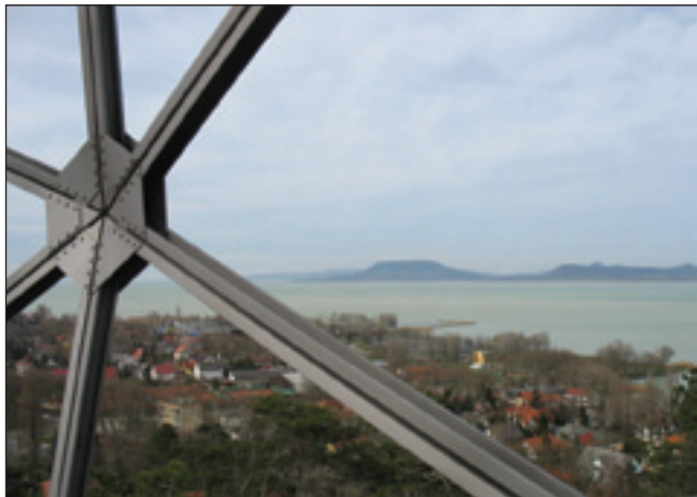
Pogled s krugle, v daljini Badacsony

S prvim marciumom bi se moglo začniti meteorološko sprto-lejtje na Vogrskom tö. Istina, ka je bilau en par topli dni, depa temperature so se eške dostakrat gibale kauli nula stopinj. Pa eške dež je dostakrat nej milostivi biu, zemla je na dosta mejstaj v rosagi nej mogla »spi-