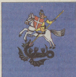
Občinski grb in zastava s podobo svetega Jurija.

Velika pridobitev za občino bo tudi novogradnja osnovne šole Sveti Jurij s telovadnico. V šoli bo