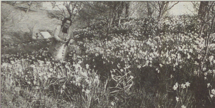
Plojevo rastišče narcis v Negovi.

Narciso najdemo v naravi v Afriki, Aziji in Južni Evropi. Tudi v Sloveniji so naravna rastišča. Eno takih je pri Veržeju, kjer prirejajo celo praznik narcis. Večja strnjena rastišča pa so tudi pri Negovi in Lokavcih. V Lokavcih že več kot sto let rastejo narcise v bližini domačije Žizkovih. Od tam so jih v preteklosti nosili kot rezano cvetje