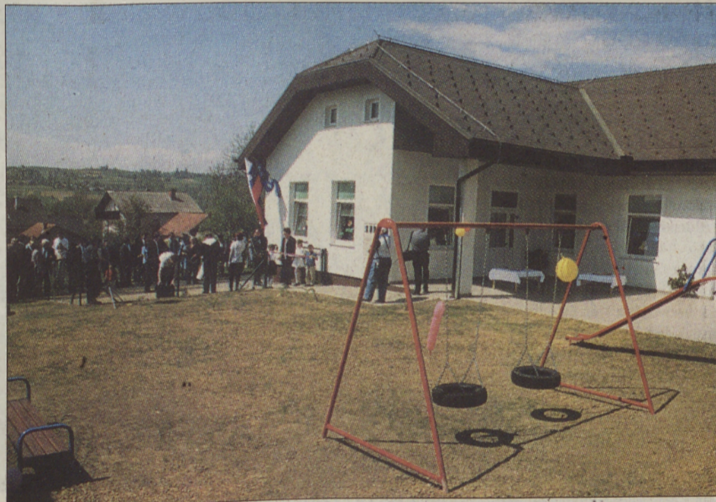
Novi vrtec bo sprejel štirideset otrok in bo imel dva oddelka. V prvem bodo otroci od 2. do 4. leta, v drugem pa od 4. leta do vstopa v šolo.

15 novih učilnic, specializirana učilnica, knjižnica s čitalnico, multimedijska učilnica, kabineti za učitelje in telovadnica z dvema