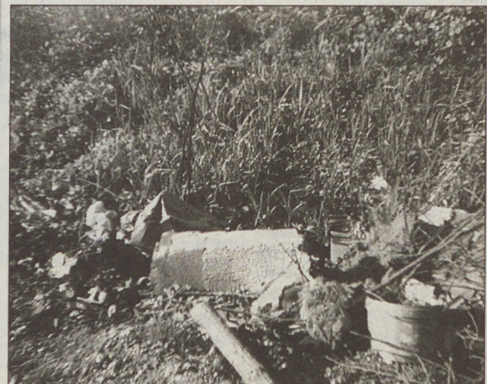
Eno od divjih odlagališč smeti in odpadkov, ki so ga odkrili v zadnji akciji učenci in učitelji OŠ Stročja vas.

Tudi lani so organizirali podobno akcijo, v kateri so počistili tri črna odlagališča odpadkov. Letos so takšna območja fotografirali in o tem obvestili