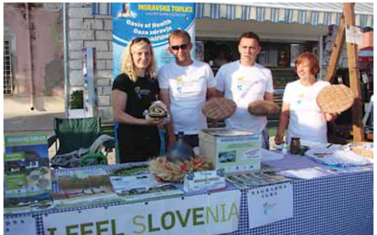
Predstavniki KS M. Toplice z dobrotami niso skoparili.

Vsi se strinjamo, da je predstavitev v Biogradu bila več kot odlična, saj je povezala tudi naše domače lokalne ponudnike, ki jim je tridnevna prireditev služila kot primer dobre prakse povezovanja s turističnimi ponudniki iz drugih sodelujočih občin (oziroma držav).