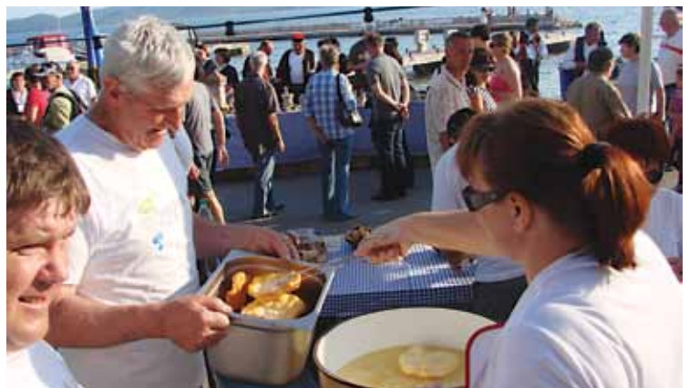
Langaš izpod rok članov KTD Filovci je šel kot za med.