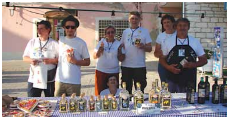
Rokodelci in pridelovalci iz občine s svojimi izdelki in pridelki.