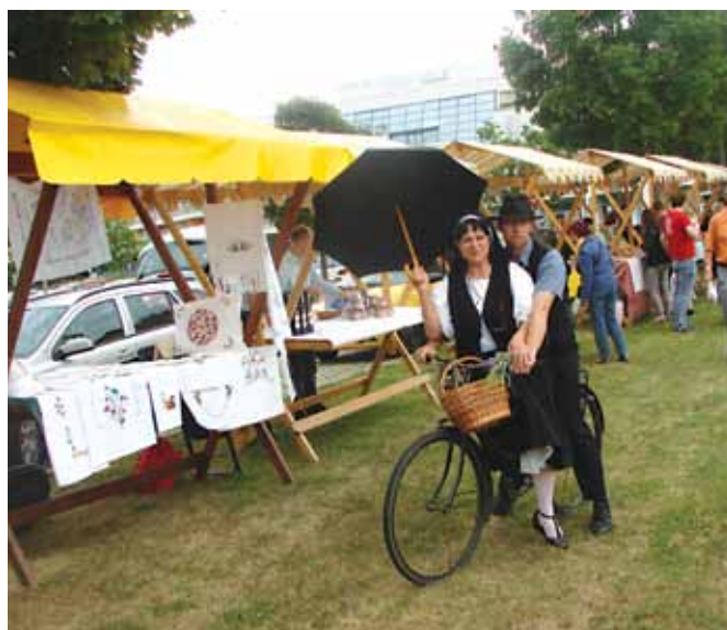
Ponudniki iz občine in širše so se predstavili na stojnicah.

V okviru prekmurskega senja so se predstavljali rokodelci in ponudniki predvsem iz domače občine, pa tudi širše. Sejem so z nostalgичno vožnjo okrog stojnic popestrili tudi člani Društva starodobnih koles – DIMEK.