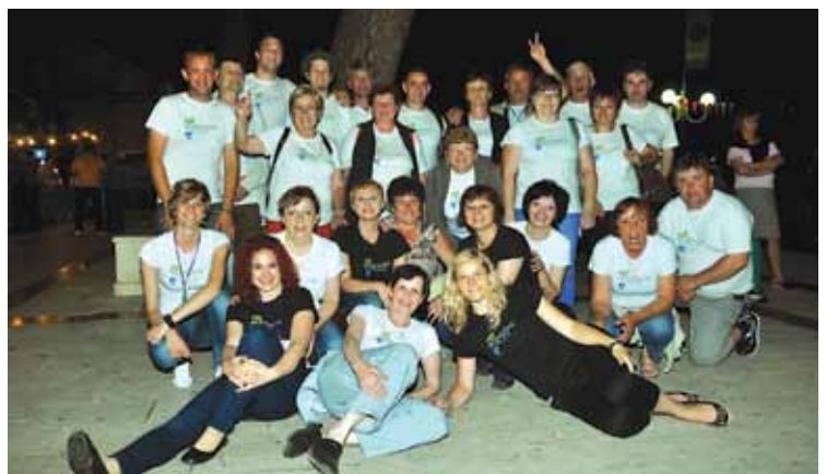
Predstavniki Občine Moravske Toplice.