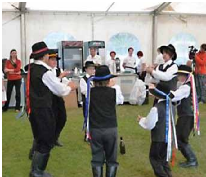
Otroška folklor DOŠ Prosenjakovci.

V programskem zabavnem delu so nastopili različni glasbeni izvajalci, med drugim FS Jožef Košič Bogojina, otroška folklor DOŠ Prosenjakovci in mnogi drugi.