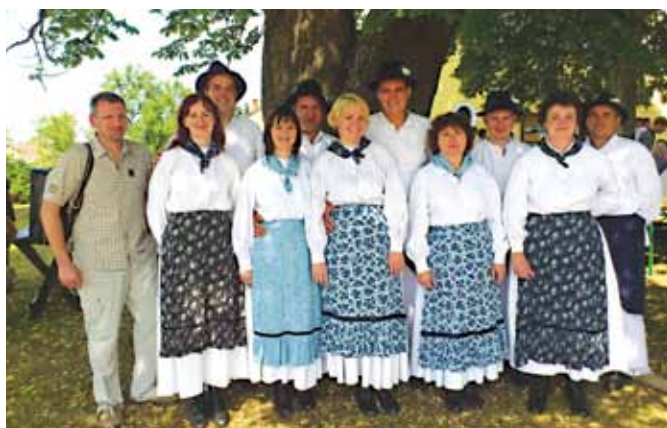
Člani folklorne skupine Bogojina, popestrijo marsikatero prireditev v Števanovcih.