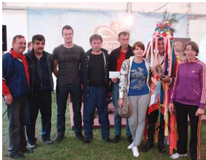
Nepremagljiva, prvo uvrščena ekipa Krncev si je zopet prislužila zavidljivo nagrado.

V okviru vaških iger so se pomerile 4 ekipe, četrto uvrščeni predstavniki ekipe iz Moravskih Toplic, tretje uvrščeni člani Mladinskega društva Filovci, drugo uvrščene Selanske bube in zmagovalna ekipa predstavnikov KS Krnci, ki je laskavi naslov osvojila že nekaj let zapored. Prve tri uvrščene ekipe so prejele zavidljive nagrade, četrto uvrščena ekipa pa tolažilne poljubčke animatork Term 3000, kar je tudi neprecenljivo.