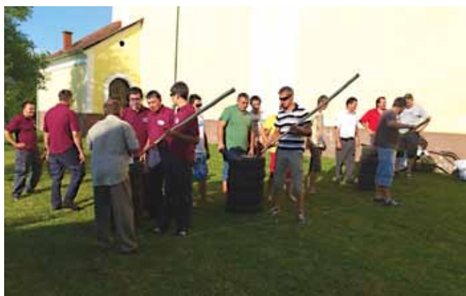
Gasilci iz Bogojine prejema jo še zadnje napotke pri gasilskih igrah.