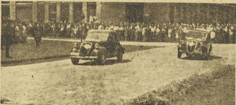
Na cestah za cestno prvenstvo Slovenije so tekmovali tudi avtomobilisti. Na sliki je posneta borba dveh »Topolinov« na ovinku z Miklošičeve na Masarykovo cesto.